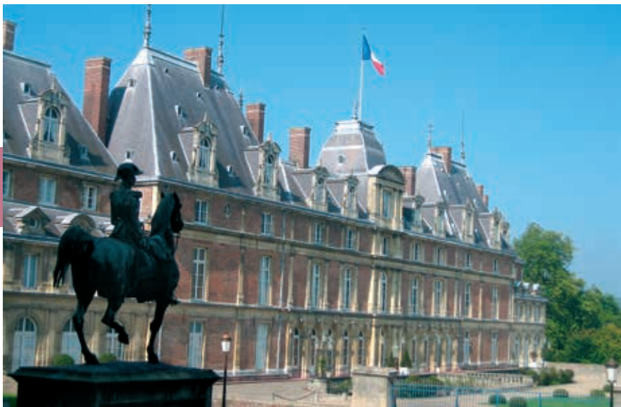
Het kasteel van Eu.