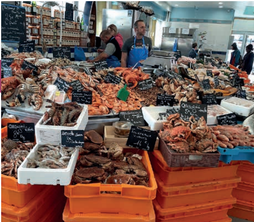
Verse vangst in Le Tréport.

betekent dat het gerecht in deze saus wordt opgediend. Veel gerechten worden gekookt of gestoofd in cider of calvados, waardoor ze een heerlijke, speciale smaak krijgen. De grote keus aan specialiteiten staat borg voor culinaire verrassingen. Let wel op, want zaken als tripes (ingewanden) of andouille (worst gemaakt van varkens- en kalfsdarmen) worden ook tot de lekkernijen gerekend, terwijl lang niet iedereen dat zal beamen.