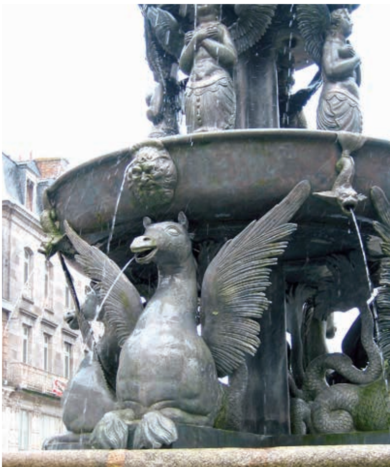
De fontein van Guingamp.