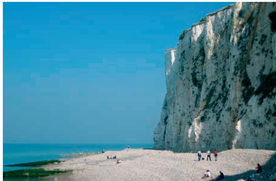
De Côte d'Albâtre bij Le Tréport.

Vlak bij de Place Carnot staat de Chapelle du Collège – van het jezuïetencollege – uit 1620, met een gevel van baksteen en beeldhouwwerk. Het meest de moeite waard zijn de zwartmarmen, met goud ingelegde graftomben van Hendrik van Lotharingen en zijn gemalin Catharina van Kleef.