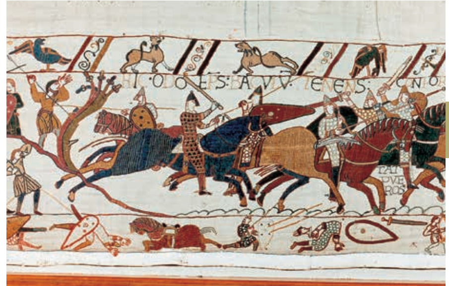
De slag bij Hastings afgebeeld op het tapijt van Bayeux.

Hertog Robert I, de nieuwbakken Frankische hertog, verzekerde de vrede en herstelde de verwoestingen. Het hertogdom verfransde snel en werd een krachtige staat; de voortaan 'Normandiërs' geheten Noormannen bouwden steden, kerken en kloosters. Hertog Richard I trouwde met een konings-