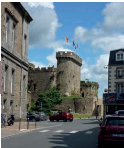
De donjon van Avranches.

p. 50). De kruisen staan in lange rijen in het gelid, indrukwekkend, prachtig en droevig. In de kapel zijn mooie tableaux aangebracht van gekleurde steen en glas, met daarin in brons de route ingelegd die de geallieerden na de landing hebben gevolgd.