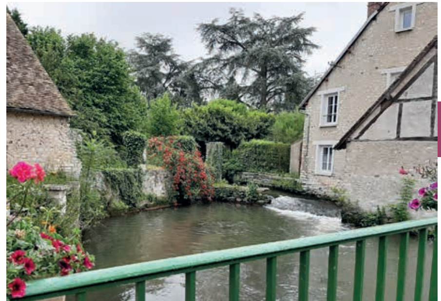
Langs de Eure.

De zuidgrens wordt gevormd door de Seine, die in Bourgondië ontspringt en 776 km verderop in het Kanaal uitkomt. De Seinevallei – waarvan het oostelijke deel in het departement Eure ligt – is met zijn mooie landschap en historische monumenten een aantrekkelijke toeristische bestemming. Centraal in de Seinevallei ligt Rouen, de hoofdstad van Normandië. Deze museumstad heeft een prachtig gerestaureerde oude binnenstad en trekt jaarlijks enorme aantallen bezoekers. De kathedraal, andere kerken en het justitiële paleis zijn hoogtepunten van gotische bouwkunst. Bijzondere middeleeuwse stra-