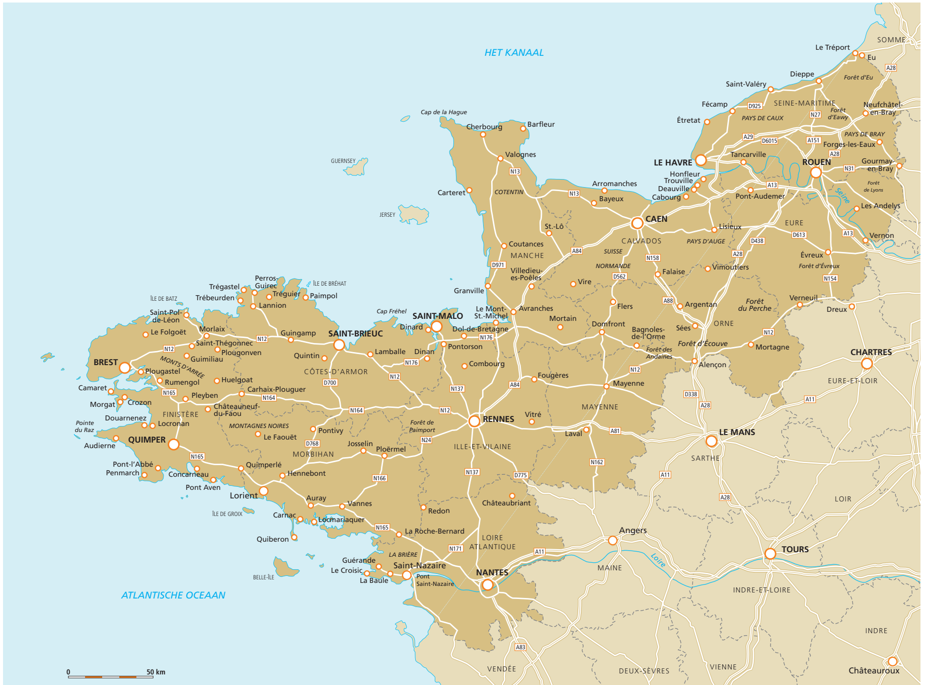
Normandië en Bretagne