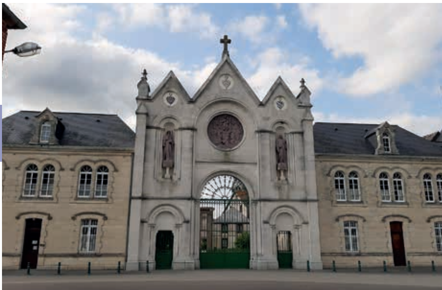
De abdij van La Trappe.