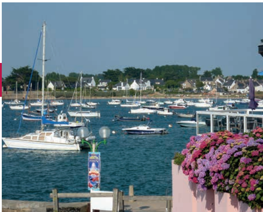
Haventje van Port-Navalo.