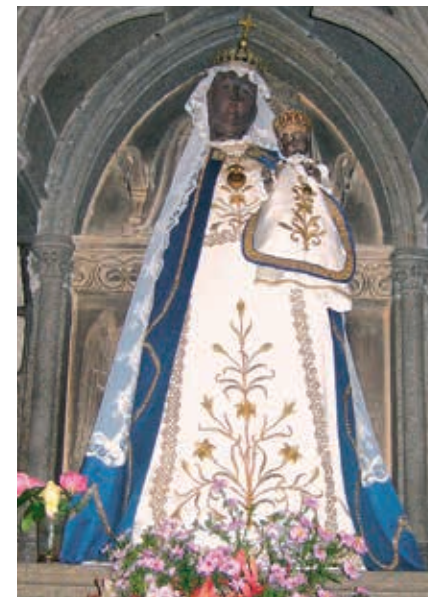
De Zwarte Madonna van Guingamp.

Enkele kilometers landinwaarts, tussen Lantic en Trégomeur ligt in een heuvelachtig park een dierentuin: de Jardin Zoologique de Bretagne . De dieren – tijgers, beren, apen, maar ook ibissen en schildpadden – verblijven in een natuurlijke omgeving, die hun oorspronkelijke milieu zo dicht