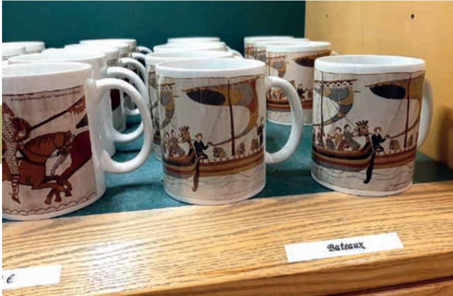
Overal: het tapijt van Bayeux.

der van de Noormannen, Rollo, die zich Robert I noemde toen hij het christelijke geloof aannam en hertog van 'Noormannenland', Normandië, werd.