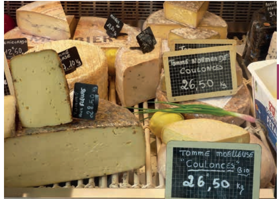
Een keur aan kazen.

Voor wie van fruits de mer houdt, zijn deze streken een luilekkerland. Er is keus in overvloed: garnalen, oesters, mosselen, kreeften enzovoort. Een plateau de fruits de mer bestaat uit een verscheidenheid van dit alles en wordt genuttigd met roggebrood, halfzoute boter en cidre brut . Natuurlijk past een muscadet of een andere goede witte wijn hier ook uitstekend bij. Visschotels bestaan dikwijls uit smakelijke combinaties zoals de Normandische tong, waarbij de vis gecombineerd wordt met oesters, mosselen en champignons, en wordt overgoten met een wijnsaus en natuurlijk met room.