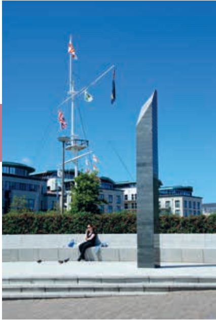
Het bevrijdingsmonument in St. Peter Port.