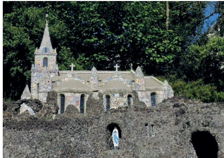
Over de Little Chapel, de creatie van broeder Déodat, zijn de meningen verdeeld.

Het graniet van de heuvel werd bestookt met explosieven, drillboren, houwen en blote handen. Talloze arbeiders vonden de dood onder neerstortende blokken. Ze werden begraven onder het graniet of beton; soms ook op het kerkhof van Les Vauxbelets.