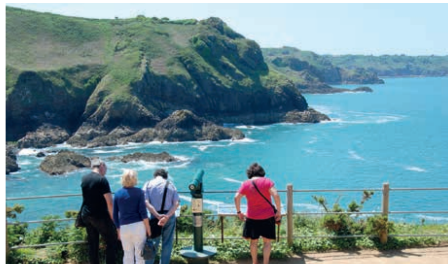
Uitzicht op de noordwestkust van Jersey.

> AMAIZIN! ADVENTURE PARK, jerseyleisure.com