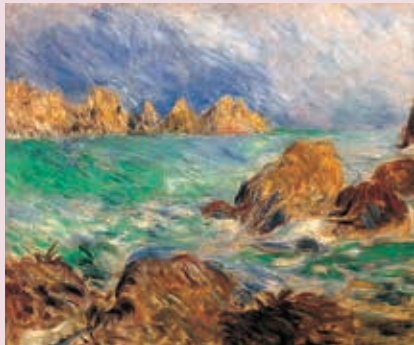
Pierre-Auguste Renoir, Marine, Guernsey , olieverf op doek, 460 x 560 mm.