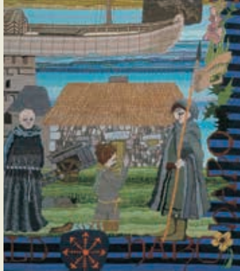
De Clameur de Haro komt ook voor op het Guernsey Tapestry.