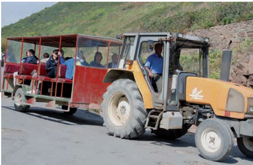
Zo word je van de haven naar The Hill (en terug) vervoerd.