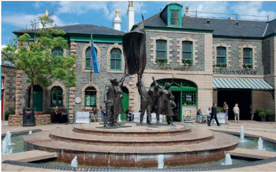
Bevrijdingsmonument in St. Helier.

valt te brengen. Smachtend probeert hij het toch: 'De violette ogen, de wonderbaarlijke teint en de vastberaden, koket-dubbelzinnige blik' .