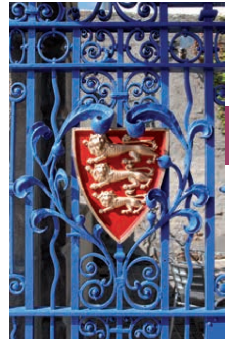
Op het rode wapenschild van de eilanden Jersey en Guernsey zijn drie koninklijke gouden luipaarden afgebeeld.

De parlementen van de eilanden zijn verantwoordelijk voor (drink)water- en stroomvoorzieningen, havens en vliegvelden. De inkomstenbelasting is laag. Verder bestaan er geen successierechten, wordt er geen belasting geheven op kapitaalwinsten en kent men er geen btw.