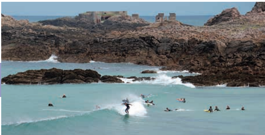
Corblets Bay heeft veel aantrekkingskracht op surfers.