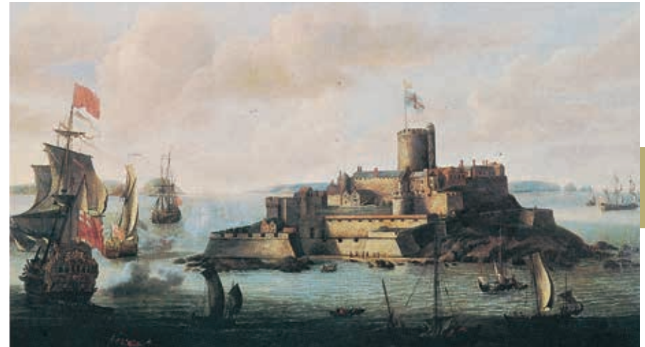
Castle Cornet in de 17de eeuw.

In 1066 versloeg de Normandische hertog Guillaume le Conquérant (Willem de Veroveraar) bij Hastings de Engelse koning Harold II, waardoor Engeland voor het laatst door een vreemde mogendheid werd bezet. Ka-