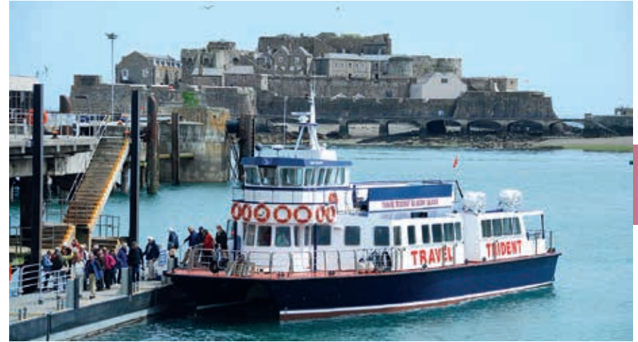
De boot naar Herm, op de achtergrond Castle Cornet.

Bij St. Julian’s Pier onthulde prins Charles in 1995 het Liberation Monument , met daarop Winston Churchills woorden: ‘... and our dear Channel Islands are also to be freed today.’ De schaduw van de obelisk wijst op 9 mei precies aan hoe laat de bevrijdingstroepen landden en welke wapenfeiten op welk tijdstip volgden.