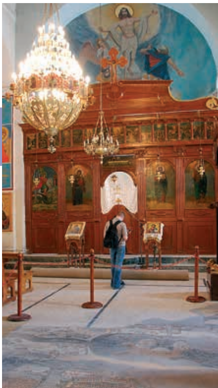
Op de vloer van de Sint-Joriskerk ligt het 6de-eeuwse Pelgrimsmozaïek. Buiten de kerk staan panelen met informatie over de kaart. Zo begrijp je beter wat je ziet.