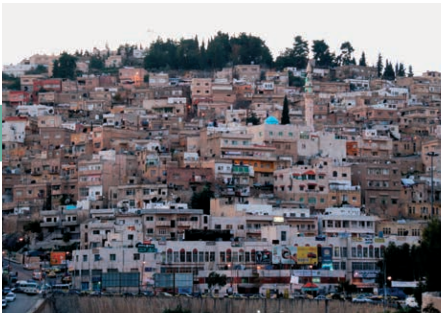
Aanzicht van Salt, dat vanwege zijn kenmerkende Nabulsi-architectuur sinds 2021 tot het Werelderfgoed van UNESCO behoort.