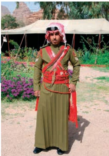
Desert Police in traditioneel uniform. Kenmerkend is de hadab , de handgemaakte kwastjesrand langs de rood-witte hoofddoek, een belangrijk nationaal symbool.

bezoekerscentrum van Rum is daarom vast niet toevallig wijselijk naast de pilaren opgetrokken.