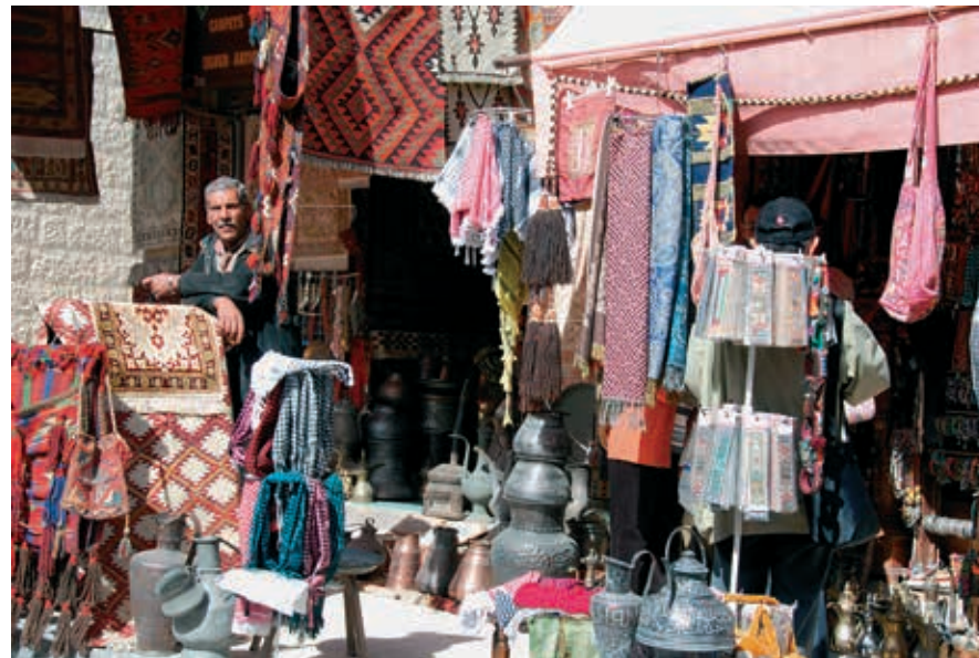
Souvenirwinkel in het centrum van Madaba. Overdag is het hier druk, maar tegen de avond, met het vertrek van de dagjesmensen, heerlijk rustig.