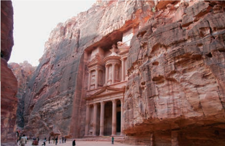
Het Schathuis van de Farao of de Treasury: de naam van Petra's beroemdste monument is bedriegelijk. Van schatten of farao's is hier geen sprake, wél van een van de rijkst versierde grafgevels van Petra.

ook herhaaldelijk beschoten om hem open te breken. De kogelgaten zijn nog duidelijk te zien.