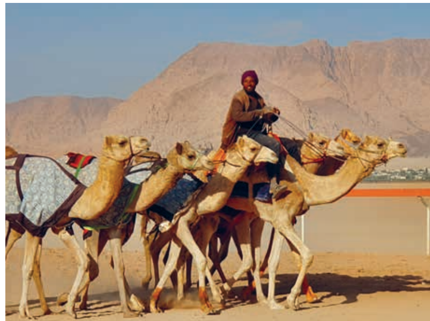
Iets buiten Diseh trainen Soedanezen dagelijks dromedarissen voor de traditionele kamelenraces van Diseh. Je kunt rustig een kijkje nemen langs de baan.

gedeeltelijk in Wadi Rum speelt, is de Lawrence-cultus gegroeid. Des te opvallender is het dat het lokale informatiemateriaal juist heel kritisch is over Lawrence' rol. Het gangbare idee dat Lawrence zelf de rotsformatie naar zijn boek heeft vernoemd, wordt direct ontkracht, maar ernstiger blijken andere overstatements . Zo zou Lawrence helemaal niet door Wadi Rum zijn gekomen, maar simpelweg de nu moderne weg naar Aqaba hebben gevolgd. Andere bronnen die in Wadi Rum naar de legendarische man zijn vernoemd, hebben dus nooit zijn dorst geleest. En Lawrence' huis is feitelijk een Osmaanse ruïne. Uiteindelijk wordt in Wadi Rums pr-materiaal toch ruiterlijk erkend dat de naam Lawrence of Arabia het nodige heeft toegevoegd aan het verhaal en de magie van Wadi Rum. Het nieuwe