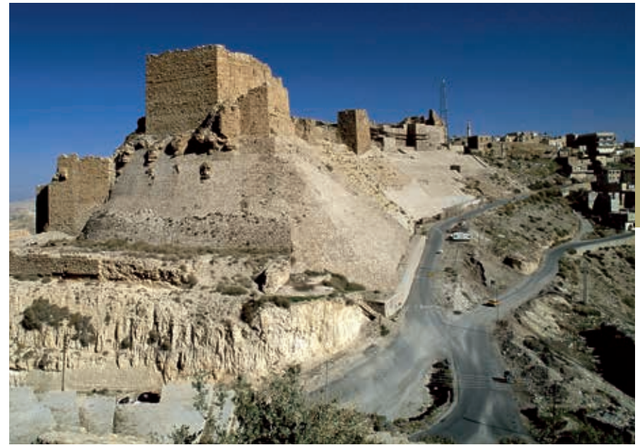
Kerak is het best bewaarde kruisvaarderskasteel van Jordanië. Het was hier dat de legendarische strijders Richard van Leeuwenhart en Saladin elkaar troffen.