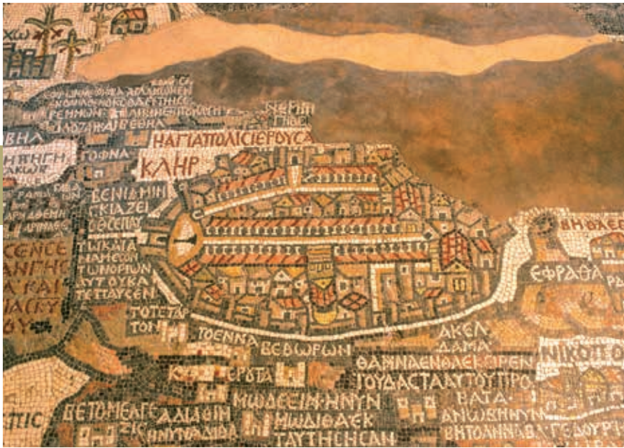
Pelgrimsmozaïek in Madaba met als middelpunt de heilige stad Jeruzalem. Het mozaïek hielp onderzoekers de mogelijke doopplaats van Jezus te traceren.