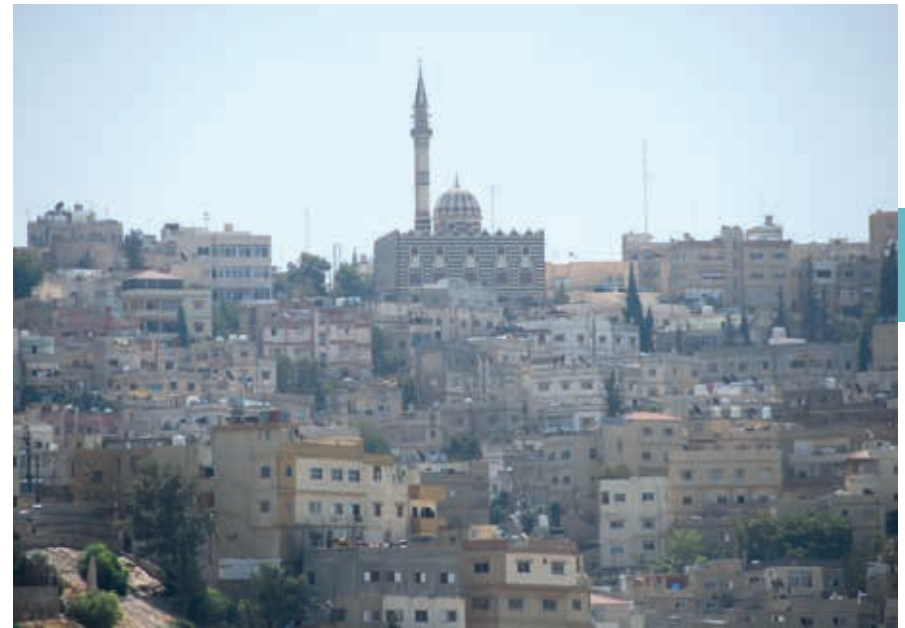
De zuidelijke heuvel Jbel Ashrafiyeh is herkenbaar aan de zwart-wit gestreepte Abu Darwish-moskee. De heuvels van Amman ogen het fraaist bij een ondergaande zon.

Extra complicerende factor is dat de circles in de volksmond wel genummerd zijn, maar op stadskarten reguliere namen hebben. Zo heet de Third Circle in de wijk Shmeisani plots Al-Malek Talal Square. Meer in het algemeen roepen officiële straatadressen vaak geen herkenning op bij de inwoners van Amman (post wordt bezorgd in postbussen in het wijkpostkantoor)