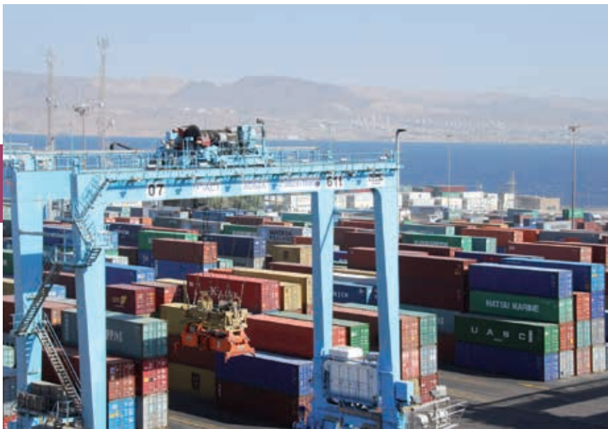
De zeehaven van Aqaba wordt verplaatst om ruimte te maken voor resorts. Aparte wegen voor het vrachtverkeer zorgen voor ontlasting van het centrum van de stad.