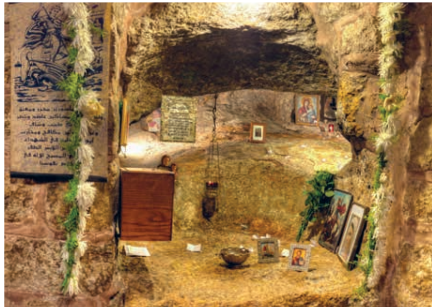
Zowel christenen als moslims komen op pelgrimage naar de grot in de Sint-Joriskerk in Salt waar Sint-Joris (Al-Khadir) verschenen zou zijn.

Het meest verfijnde voorbeeld van een 19de-eeuwse Nabulsikoopmanswoning in de regio is waarschijnlijk Abu Jaber's huis, gebouwd tussen 1892 en