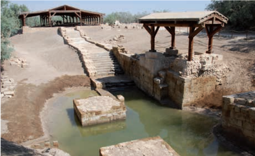
De doopplaats van Jezus waar vier torenachtige bouwsels het lage rivierwater in een kruisvorm dwingen.