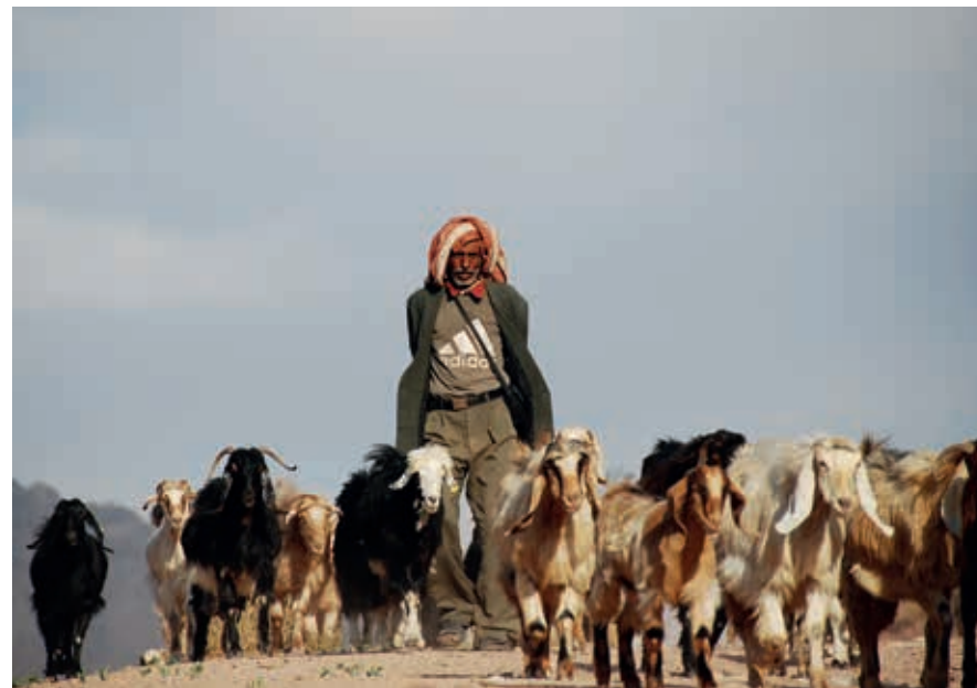
De gemiddelde plattelander heeft het niet breed. Met het toenemende gebrek aan water drogen bestaansbronnen zoals de geitenhouderij letterlijk op.

Naast het toerisme, dat normaliter, buiten de coronapandemie om, ruim 10% van het geld in het laatje brengt, zijn belangrijke ‘geldmakers’ in Jordanië (dat niet alleen geen olie heeft, maar ook nauwelijks andere grondstof-