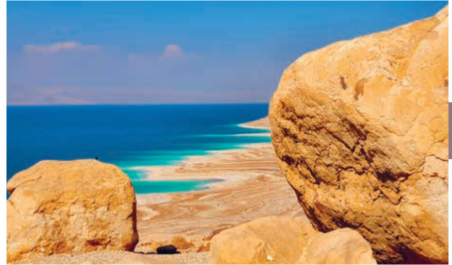
De uitgedroogde oevers van de Dode Zee vormen een alarmerend signaal. Pessimistische wetenschappers stellen dat de zee in 2050 verdwenen zal zijn.

Het indikken van het water heeft inmiddels een zoutgehalte van meer dan 30% opgeleverd. Daarmee is de Dode Zee negen keer zouter dan de Middellandse Zee. Vanzelfsprekend overleeft er geen vis of waterplant onder deze omstandigheden. Toch is de Dode Zee niet helemaal dood. Op de plek waar het Jordaanwater in de zee vloeit, kunnen nog net wat micro-organismen overleven.