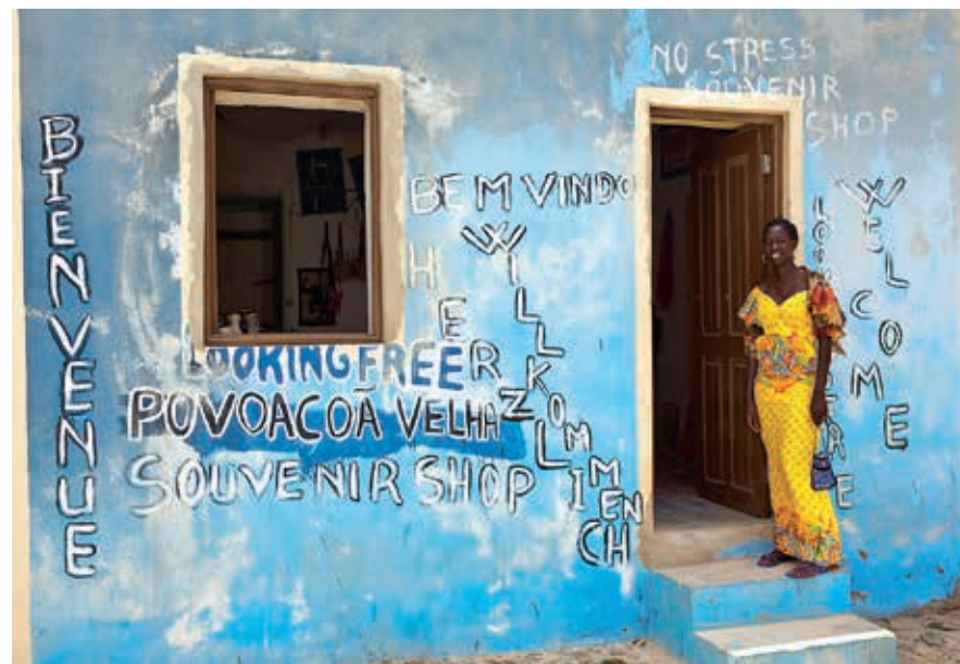
Senegalees souvenirwinkeltje in Povoação Velha.

João Galego is een alleraardigst dorpje met kleurrijke huisjes, bloeiende bomen en planten, enkele winkeltjes en twee bar-restaurantjes; Rencontre is een aanrader. Er worden heerlijke lunches gemaakt, met verse groenten, rijst en bonen en naar keuze kip of tonijn. Couleur locale gegarandeerd. Even verderop ligt Fundo das Figueiras , ook een aardig dorp met enkele voorzieningen, en weer wat verderop kom je in het iets saaiere dorp Cabeço das Tarafes . Tezamen worden de drie dorpen Norte genoemd. Ze liggen in het vruchtbaarste deel van het eiland; een ribeira zorgt met enige regelmaat voor water waarmee kleinschalige landbouw bedreven kan worden. Vanuit Norte is het nog 5 km naar de oostkust.