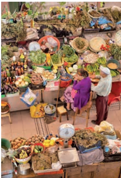
In het marktgebouw van Mindelo.

spektakel op zo'n markt te bekijken en te zien wat er zoal uit de oceaan wordt gevist. 's Morgens is er de meeste activiteit.