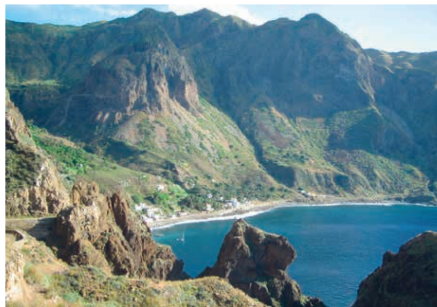
De baai van Fajã d'Água, Brava.

De Kaapverdische archipel heeft een vulkanische oorsprong. Diep onder de oceaan zijn op dit deel van de Afrikaanse tektonische plaat vulkanen omhoog gestuwd die uiteindelijk boven de zeespiegel uitkwamen, waarna wind en water aan hun schurende en slijpende erosiewerk begonnen. De Kaapverdische eilanden zijn overigens niet in hetzelfde tijdperk ontstaan. Integendeel, er zijn grote verschillen in ouderdom. De oostelijke eilanden Boa Vista en Sal zijn naar schatting al zo'n 26 miljoen jaar geleden ontstaan, São Nicolau is pakweg 12 miljoen jaar oud, en Fogo is pas 100.000 jaar geleden boven de oceaan uitgekomen. In geologische termen is het daarmee een piepjong eiland. Het is nog volop in ontwikkeling, want de vulkaan van Fogo is actief; de laatste uitbarstingen waren in 1995 en eind 2014.