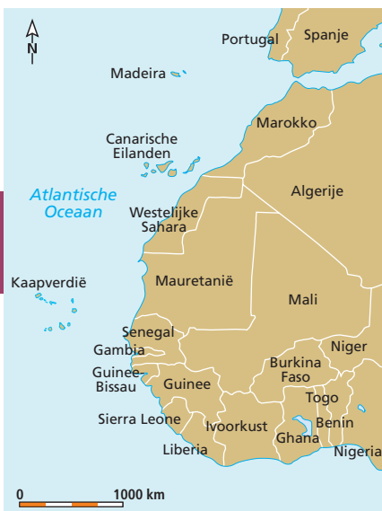
Kaapverdië in de regio