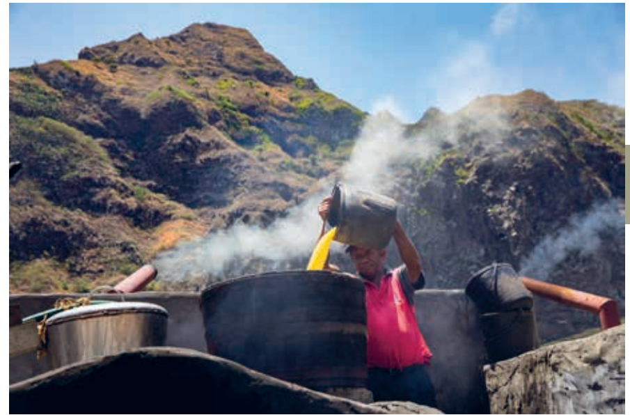
Groguestokerij op Santo Antão.

Vanuit Paúl gaat de kustweg verder naar het zuidoosten. Je komt hier weer langs diverse ribeira's en valleien die in de bergwanden zijn uitgesleten, zoals de Ribeira das Pombas en Ribeira de Janela. Vooral de laatste is weer een mooie groene vallei. Het plaatsje Janela ligt net even van de weg af