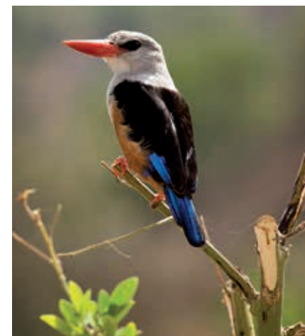
De grijskopijsvogel voelt zich vooral thuis op Santiago en Fogo.

Het zeeleven rond de eilanden is een stuk rijker en gevarieerder dan het leven op het land. In de oceaan zwemmen bijvoorbeeld een stuk of 17 walvis- en dolfinsoorten, waaronder potvissen, blauwe vinvissen, Brydevinvissen, Indische grienden, gestreepte dolfinen, dolfinen van Cuvier, witlipdolfijnen, spitsnuitdolfijnen en tuimelaars. De meeste soorten zijn seizoengasten. Bijzonder is de bulrugwalvis. Een populatie van enkele honderden bulrugwalvissen zwemt ieder jaar vanuit de Noordelijke IJzsee naar Kaapverdië om zich daar voort te planten, vooral ten westen