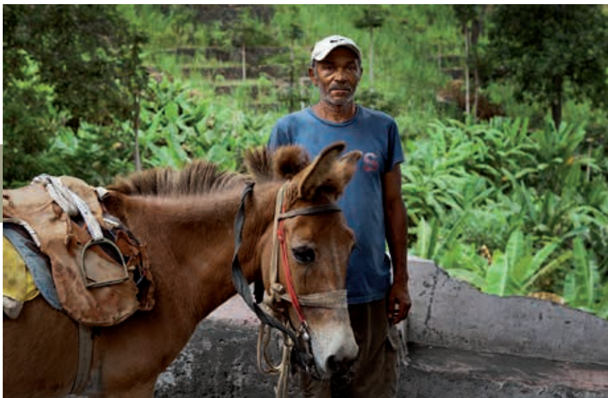
Inwoner van Janela, in het noordoosten van het eiland.