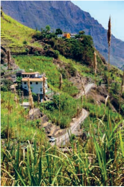
Weggetje en suikerriet in Ribeira do Paúl.

den en winkeltjes, en rond de huizen zie je velden met mais, suikerriet en bananenbomen. Op een rots hoog boven het stadje staat een beeld van Sint Antonius met kind op de arm, beschermheilige van onder meer vrouwen, kinderen, armen en reizigers.