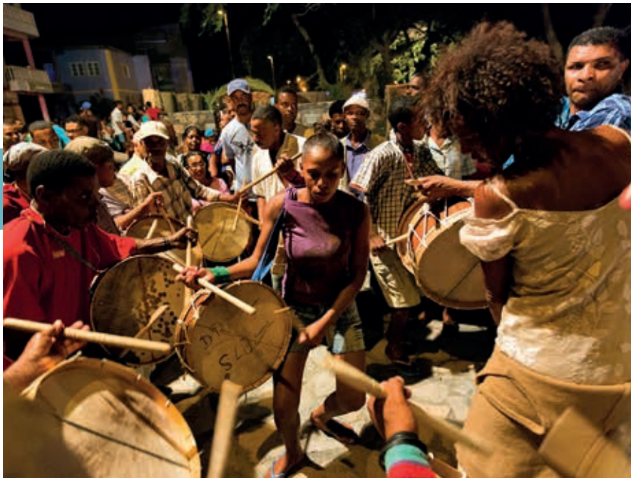
Trommelaars op straat in Porto Novo, ter gelegenheid van de feestdag voor Johannes de Doper.