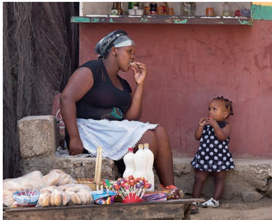
Winkeltje in São Jorge dos Orgãos, centraal Santiago.

Santiago meet 990 km 2 en is daarmee ruim 200 km 2 groter dan Santo Antão, het tweede eiland van Kaapverdië. Er wonen circa 290.000 mensen. Hoofdstad Praia ligt in het zuidoosten aan een grote baai. Ten westen ervan is Cidade Velha de oude koloniale hoofdstad. Het zuidelijke en zuidwestelijke deel van het eiland is landschappelijk niet zo interessant. Dat geldt niet voor het centrale en noordelijke deel van het eiland. Hier rijzen twee grillige bergketens op, respectievelijk de Serra de Pico da Antónia en de Serra Malagueta, beide genoemd naar de hoogste bergtoppen in de ketens. De Pico