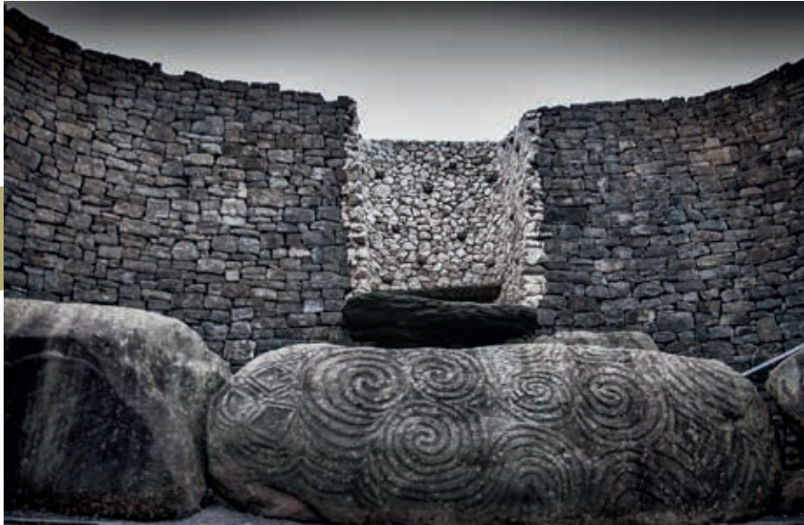
Het befaamde megalithische ganggraf van Newgrange.