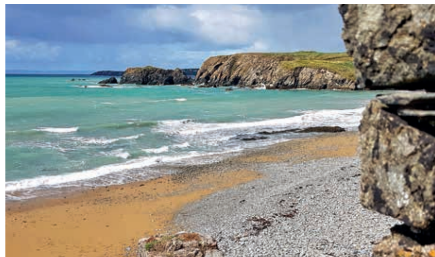
Rotskusten bepalen het beeld rond het gehele eiland.

Het Ierse klimaat leent zich niet voor een zonzakantie met lange, lome dagen aan het strand. Het land heeft een gematigd zeeklimaat met relatief koele zomers en milde winters, doorgaans zonder vorstdagen. Door de westelijke ligging in de Atlantische Oceaan vangt het eiland veel oceaandepressies op, wat betekent dat er veel regen valt en er vaak wind staat. Het weer kan daardoor op sommige dagen erg afwisselend zijn. Soms komt de regen met bakken uit de hemel, waarna het even later weer helemaal opentrekt en er felblauwe opklaringen zijn, soms is de kust gehuld in dichte mistwolken, waarna een opstekende zeewind opeens alles weer schoonblaast. Voordeel is dat je niet zelden kunt genieten van fraaie wolkenluchten en er opvallend vaak regenbogen aan de hemel staan. En op de dagen waarop het écht zonnig en warm is, spoeden de Ieren zich naar een strand of naar een meer om er volop van te kunnen genieten.