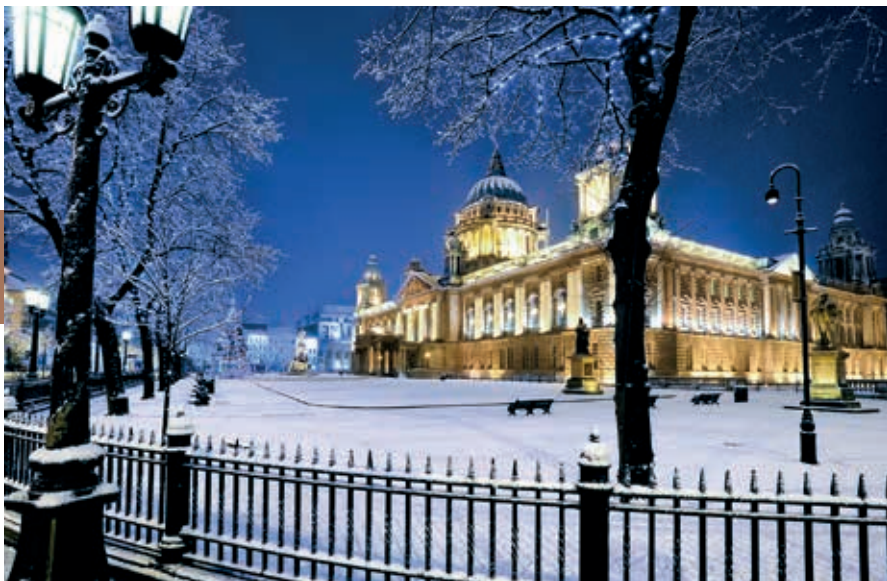
The City Hall in de winter.

ontstaan spatte uiteen, onroerendgoedprijzen daalden met 30 tot 40% en de werkloosheid steeg weer. Daarna krabbelde de stad weer overeind en kreeg men de opgaande lijn opnieuw te pakken. De stad telt heden ten dage inclusief voorsteden ongeveer een half miljoen inwoners. Trek je de voorsteden eraf, dan blijven er ongeveer 280.000 over.