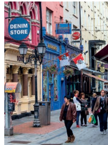
Winkelen in het centrum van Cork.

Dublin houden, hebben ze hun stad, met een knipoog, als bijnaam ‘The People’s Republic of Cork’ gegeven. Op korte afstand ten zuiden van de stad biedt Cork Airport verbindingen met de buitenwereld. Het is de tweede luchthaven van Ierland; men verwerkt er jaarlijks bijna 2,5 miljoen passagiers. De haven is na die van Dublin de grootste van de republiek, er is vrij veel industrie en Cork heeft in de recente jaren van economische voorspoed behoorlijk wat ICT-bedrijvigheid kunnen aantrekken. Door het jaar heen zijn er bijna 20 culturele festivals bij te wonen, en in 2005 was Cork de culturele hoofdstad van Europa. De stad is ook bisschopszetel voor zowel een rooms-katholieke als een anglicaanse bisschop; gelukkig rollen ze niet vechtend over straat, zoals aanhangers van beide kerken in Noord-Ierland wel jarenlang hebben gedaan.