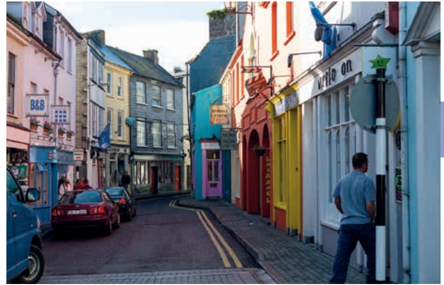
Gekleurde winkelpuien in het centrum van Kinsale.

Vanuit Fermoy langs de Blackwater naar het westen kom je na zo'n 30 km bij Mallow, een streekcentrum met 11.000 inwoners. Neem je in Mallow de N20 naar het noorden, dan voert de route langs het plaatsje Buttevant. Het