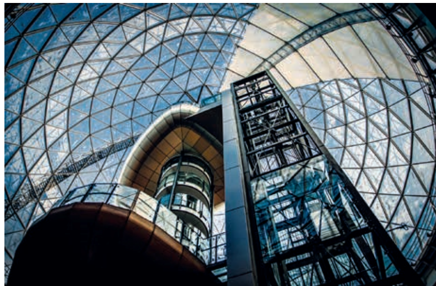
Victoria Square Shopping Centre, spectaculaire koepel.

Binnen kun je het gebouw per gratis rondleiding bezichtigen. Wil je niet met een rondleiding mee, dan kun je ook gewoon naar binnen stappen om