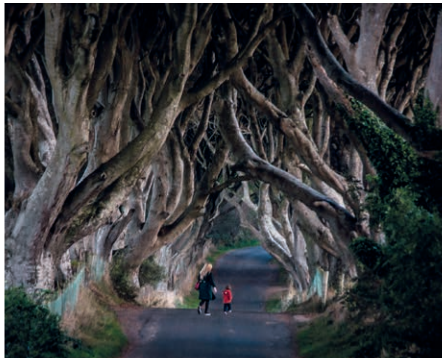
Tussen de oude beuken van The Dark Hedges zou een vrouwelijke geest rondspoken.

Na Carnlough loopt de A2 direct langs zee verder, een prachtig stuk weg met een hoog plateau aan de linkerzijde. Na 9 km heb je het plateau gerond en bereik je de plaats Glenariff , gelegen aan Red Bay en ook wel Waterfoot genoemd. Langs de baai ligt hier een aardig strand met grasvelden erachter. Een kleine 5 km het binnenland in vind je het Glenariff Forest Park aan weerszijden van de Glenariff River en de A43. Op een aardige waterval na is het bosgebied eerlijk gezegd niet bijzonder interessant, dus je kunt je de omweg wellicht besparen. Twee kilometer boven Glenariff bevindt het grotere Cushendall zich eveneens aan Red Bay.