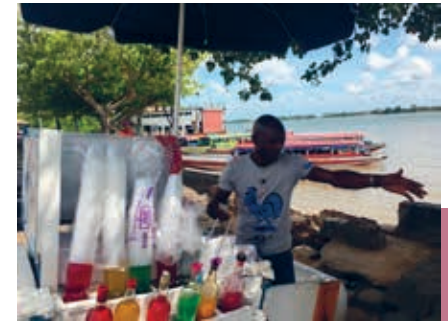
Schaafijsverkoper aan de Waterkant waar korjalen naar Meerzorg vertrekken.

Met Pieter Versterre, de volgende gouverneur, lag Combé ook geregeld in de clinch. Die bleek op grote schaal te hebben gezwendeld met plantages en nam het niet zo nauw met het afdragen van belastingen. Ondanks alle tegenwerking zag Combé na verloop van tijd kans de orde te herstellen. Pas na de afschaffing van de slavernij trok de Combéwijk ook andere bevolkingsgroepen aan. De gegoede burgerij verhuisde naar percelen verder buiten het centrum. Zo heeft de stad zich in de loop der eeuwen steeds verder uitgebreid. Omdat er bijna geen hoogbouw verrees en de meeste huizen werden omgeven door een erf, ontstond een uitgestrekt stedelijk gebied. Waar in vroeger tijden nog plantages waren, zijn inmiddels ruim opgezette woonwijken ontstaan. Een groot deel van de wijk Uitvlugt in Paramaribo-Zuid behoorde oorspronkelijk toe aan de plantersfamilies Graanoogst en Van Brussel. Tientallen straten, van de Rudie- en de Joanlaan tot de Henkielaan en de Gondastraat, verwijzen naar de vele nakomelingen van beide plantagehouders.