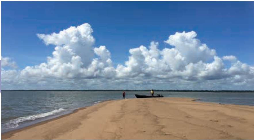
Tigri Bank, zandbank in de oceaan, 20 minuten varen van Galibi.