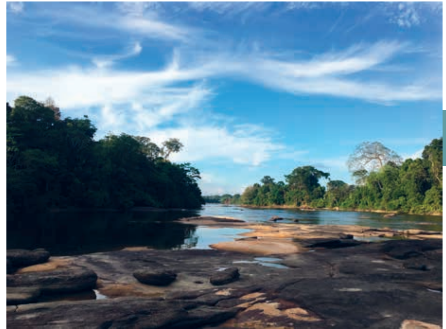
Rotsen bij Danpaati.

Centraal in het dorp bevindt zich het krutu oso . Dit vergaderhuis is een grotere, overdekte, halfopen ruimte voor dorpsvergaderingen en gemeenschappelijke activiteiten. Het is in verkiezingstijd ook het decor voor de drukbezochte partijbijeenkomsten. Dan worden de kopstukken van de landelijke partijen beurtelings uit de hoofdstad ingevlogen.