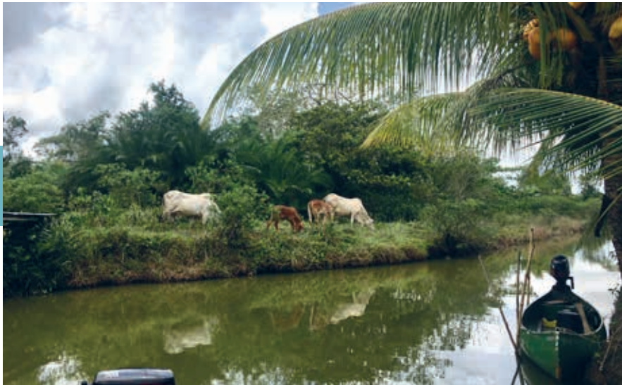
Buffels op Matapica.