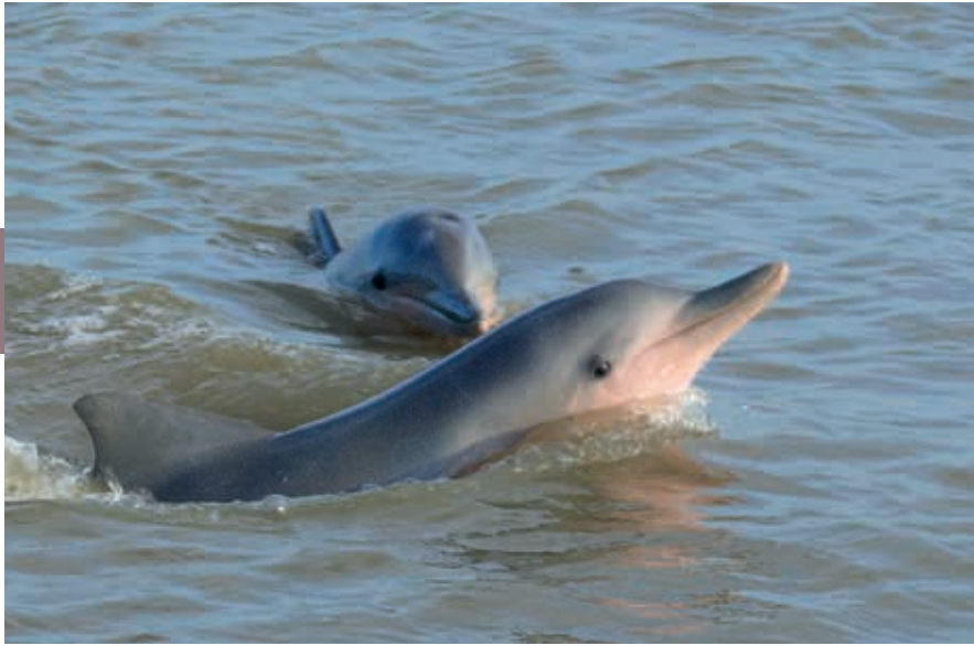
Tijdens de Sunset Tour bij de monding van de Commewijnerivier in de Surinamerivier, duiken geheide van nature honkvaste Guinese dolfinen (met roze buik) op.

de Commewijnerivier op om aan te leggen bij plantage Johan en Margaretha voor een hapje en een drankje. Geen dolfinen gespot? Dat gebeurt hoogst zelden. Sommige bootsmannen bieden hun gasten dan gratis een nieuwe tour aan.