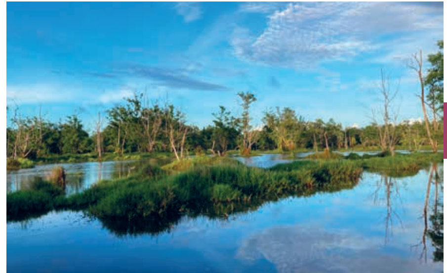
Tussen de Commewijnerivier en de Atlantische kust ligt het moerasachtige natuurgebied Matapica: geen vergelijk met de Vinkeveense Plassen.

En nadat Biliton zich al in 2010 had teruggetrokken uit Suriname, besloot Suralco de fabriek op Paranam in november 2015 te sluiten. Daarna brak overloos politiek gekrakeel uit over de toekomst van de bauxietindustrie. Om de voorraden in het westen daadwerkelijk te exploiteren zijn miljardeninvesteringen nodig terwijl de vraag naar aluminium wereldwijd sterk is gedaald. Intussen neemt de Surinaamse overheid nog altijd tegen een veel te hoog tarief elektriciteit af van de waterkrachtcentrale. Na het vertrek van Alcoa uit Suriname werd jarenlang vruchteloos onderhandeld over de bestemming