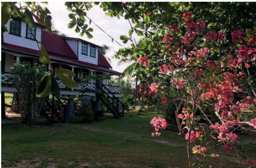
Plantage Frederiksdorp in oude glorie hersteld.