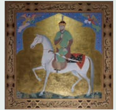
Amir Timur werd heel vaak zittend op een paard uitgebeeld.

Zijn nalatenschap is in Oezbekistan duidelijk zichtbaar. Veel van de belangrijkste nog bestaande bouwwerken in het land zijn gebouwd tijdens zijn bijna 35-jarige regeerperiode of werden er in de bouwstijl door beïnvloed. Sinds de onafhankelijkheid heeft Amir Timur een nog grotere status verworven in Oezbekistan. De eerste president na het Sovjettijdperk, president Karimov, koos Timur als het boegbeeld van het pasgeboren land, herschreef de geschiedenis. Hij negeerde daarbij grotendeels de negatieve kanten van de staatsman en brak zo los van zijn Sovjet-erfenis. Het deed het Oezbeeks nationaliteitsgevoel sterk opleven. Timur wordt geëerd met monumenten door het hele land, waaronder in Tasjkent, Samarkand en Sjahrisabz.