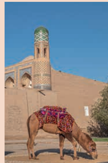
Zicht op het mausoleum.

In 1717 gebruikte de heerser Shergazi-Khan een sluwe militaire strategie om het Russische leger tijdens zijn eerste expeditie naar Centraal-Azië te verslaan. De overlevende soldaten werden als gevangenen naar Xiva gebracht en gedwongen de rest van hun verdere leven slavenarbeid te verrichten. De tot slaaf gemaakten werd beloofd dat zij naar hun vaderland zouden mogen terugkeren zodra het werk voltooid was. Maar tegen het einde van de bouw begon Shergazi-Khan steeds nieuwe taken te bedenken om hun terugkeer onmogelijk te maken. Uiteindelijk wist hij dit enkele jaren te rekken. Toen de khan in 1728 voor een inspectie kwam, doodden de boze tot slaaf gemaakten hem. Hij werd begraven in het mausoleum dat zijn naam draagt. In 1740 veroverde de Perzische heerser, Nadir Shah, Xiva en bevrijdde de Russische krijgsgevangenen en waarschijnlijk alle andere tot slaaf gemaakten.