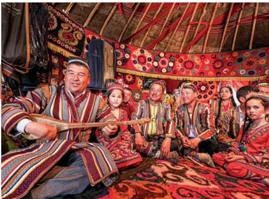
Binnen in een yurt is het warm, gezellig en vaak muzikaal. Sla een uitnodiging om dit mee te maken zeker niet af.