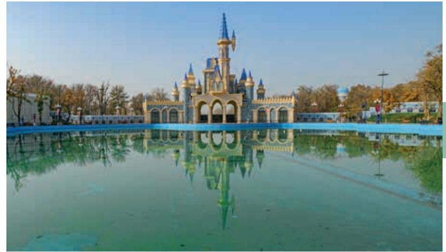
Tasjkent bewijst met Magic City de mooiste attractieparken van de wereld te kunnen evenaren.

➤ VRIENDSCHAPSPALEIS VAN DE VOLKEREN, Furkat Street 3