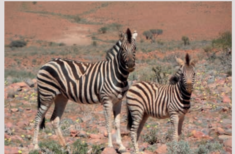
Elke zebra heeft een uniek strepenpatroon.

Hoewel de dichtheden van vooral grotere zoogdieren zeer gering zijn, worden de volgende dieren waargenomen: insecten, schorpioenen, spinnen, slangen, hagedissen, kameleons, springbok, spiesbok, woestijnolifant, leeuw en luipaard. Bruine hyena's en zadeljakhalzen stropen het strand af, op zoek naar dode zeehonden, vogels en vis. Op de schaarse plekken met iets meer begroeiing, zoals droge rivierbeddingen, leven ook zwarte neushoorn, zebra, koedoe, giraffe en verschillende vogelsoorten. Om het broze even-