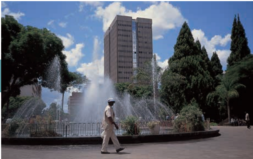
Harare is het economisch hart van Zimbabwe. De moderne gebouwen geven de stad een meer Europese dan Afrikaanse uitstraling.