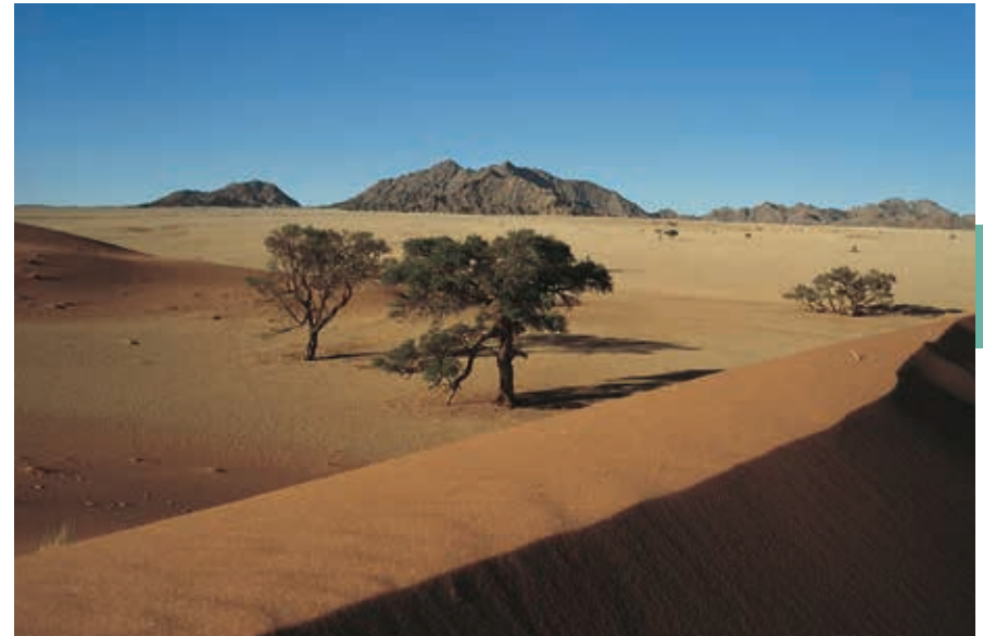
Uitzicht vanaf Elim Dune, bij Sesriem.

In het plaatsje Rehoboth en omgeving, 100 km ten zuiden van Windhoek, woont een unieke bevolkingsgroep die zichzelf Basters noemt. Hun geschiedenis gaat terug naar 1652, het jaar dat de eerste Hollandse kolonisten onder leiding van Jan van Riebeeck zich op de Kaap vestigden. Veel Hollanders stichtten gezinnen met Namavrouwen, ook wel Hottentotten genoemd. Het mulattenvolk dat daardoor ontstond, noemde zich Basters. In 1868 dreigde een confrontatie met witte kolonisten en 90 Basterfamilies trokken onder