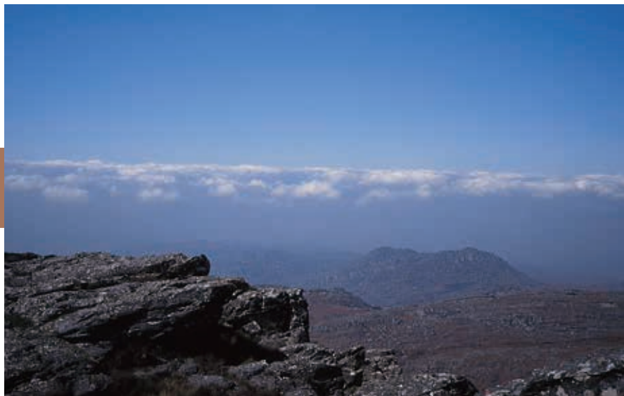
De beklimming van de Binga (2437 m) is een uitdaging voor de bezoekers aan Chimanimani. Vanaf de top kijk je uit over Mozambique.

Vogels zijn wel volop te zien. In de Eastern Highlands leeft een dertigtal vogelsoorten die elders in Zimbabwe, Botswana en Namibië niet voorkomen. Het opvallendst zijn de Afrikaanse sperwer ( redbreasted sparrow hawk ), zilverneushoornvogel ( silverycheeked horn bill ) en de emeraldhoeningzuiger ( malachite sunbird ).