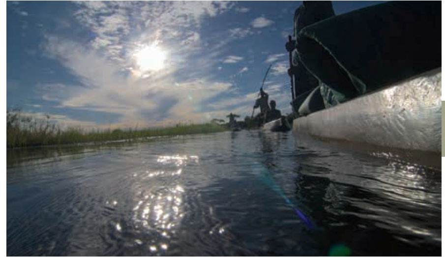
De Okovanga Delta: veel mooier en indrukwekkender dan dit wordt de wereld niet.

De Okavango Delta is een enorm moerasgebied dat is ontstaan op de plaats waar de Okavango de Kalahari instroomt. Naast grote aantallen krokodillen en nijlpaarden leven er talloze soorten vis en landdieren. Het is zonder meer een van de meest bijzondere natuurgebieden ter wereld. Dit enorme moerasgebied wordt gevoed door de Okavango, een 1600 km lange rivier die ontspringt in het hoogland van Angola, zuidwaarts stroomt door de Namibische Caprivi Strip en uitmondt in de Kalahari. De Okavango gedraagt zich tot in het uiterste noorden van Botswana als een normale tropische rivier. Maar dan stuit zij op een zogenoemde panhandle (pannensteel) en vertakt in tal van stromen. De hierdoor gevormde binnenlanddelta (15.000 km 2 ) is de grootste ter wereld en bestaat uit een systeem van rivierarmen en stroompjes, beboste eilanden, riet-, lelie- en papyrusvelden, grasvlakten en savanne. Redenen voor de vertakking zijn het egale oppervlak, de zanderige ondergrond en het geringe verval van slechts 16 m over de laatste 200 km. Het zeer lage verhang van slechts 8 cm per km maakt dat het water zeer langzaam door de delta stroomt. Het water doet er een halfjaar over om vanuit Angola naar de zuidelijkste punt van de delta bij Maun te komen. Dit