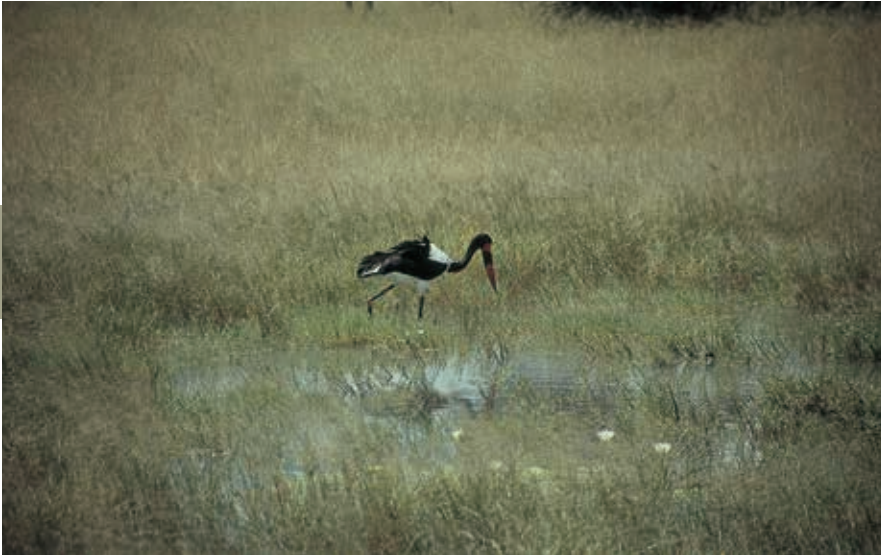
Een zadelbekooievaar in de Okavango Delta.

tweede helft van de regentijd trekken kuddes van duizenden zebra's, gnoes en spiesbokken naar dit gebied om de grasvlakten te begrazen. In hun kielzog volgen leeuwen, hyena's en wilde honden. Andere dieren die hier voorkomen, zijn impala, koedoe, giraffe en hartebeest.