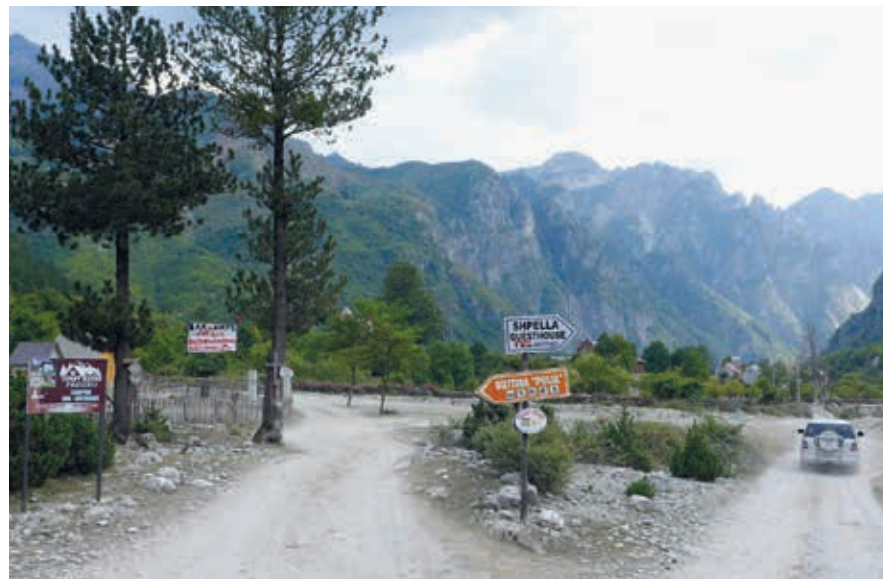
Theth is nog altijd zanderige staat. Zodra het asfalt het dorp bereikt, zo verwacht men, zal het toerisme losbarsten.

Ga je aan het eind van het pad niet links maar rechts, over een van de houten overstapjes die de met hekken gescheiden landjes van verschillende eigenaren met elkaar verbinden, dan kom je bij de Lock-in Tower (Kulla Ngujimit) terecht, een versterkte toren gebouwd op een rots. Dergelijke torens, die je vroeger in elk bergdorp vond, werden gebruikt om mannen te beschermen die in bloedvetes verwickeld waren geraakt (zie p. 25). Zij mochten er een week of twee blijven terwijl bemiddeld werd met de familie van degene die uit was op wraak. Hierna moesten ze ofwel een of andere belofte nakomen, vaak in de sfeer van trouwen, ofwel rennen voor hun leven. De toren van Theth is bewaard dankzij zijn beroemde bezoekers. In 2007 zijn de muren en daken met Nederlandse hulp hersteld. Op wisselende tijden