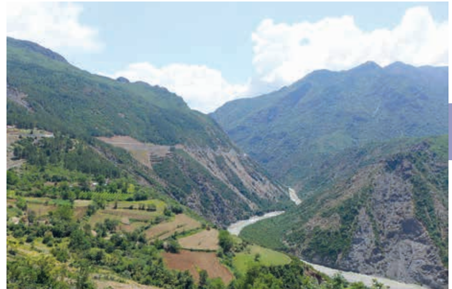
Uitzicht vanaf de SH71 langs de Devol bij Bratilë.

Op de berg Rungajë (1945 m) ontspringt het riviertje de Dëshnicë, dat met andere stromen de voeding voor de Osum vormt. Hier werd in 1936 de