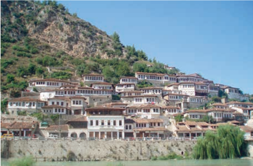
Berat wordt ook wel de stad van duizend ramen genoemd.

aarde. De graven werden na herhaaldelijke plundering uitgeruimd. In de gebiedsruimte zie je beschilderde wandkasten en mooie glas-lood-ramen, het meest verrassend is het plafond van houten panelen beschilderd met groene en gouden geometrische figuren in een krans van arabesken. De tekke geldt als een van de meest elegante van zijn tijd.