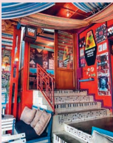
Interieur van Nouvelle Vague.

> Radio Bar, ook bekend als club, lekker terras vol curiosa, beetje gek, Rruga Ismail Qemali P. 29 Ap. 1, open dag. 10-0 uur.