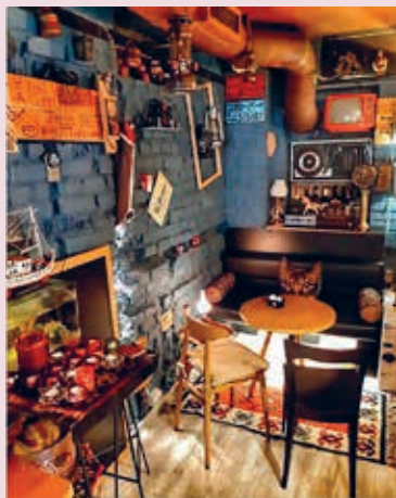
Interieur van Lounge 18 Grade.