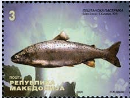
De Salmon letnica op postzegelformaat.