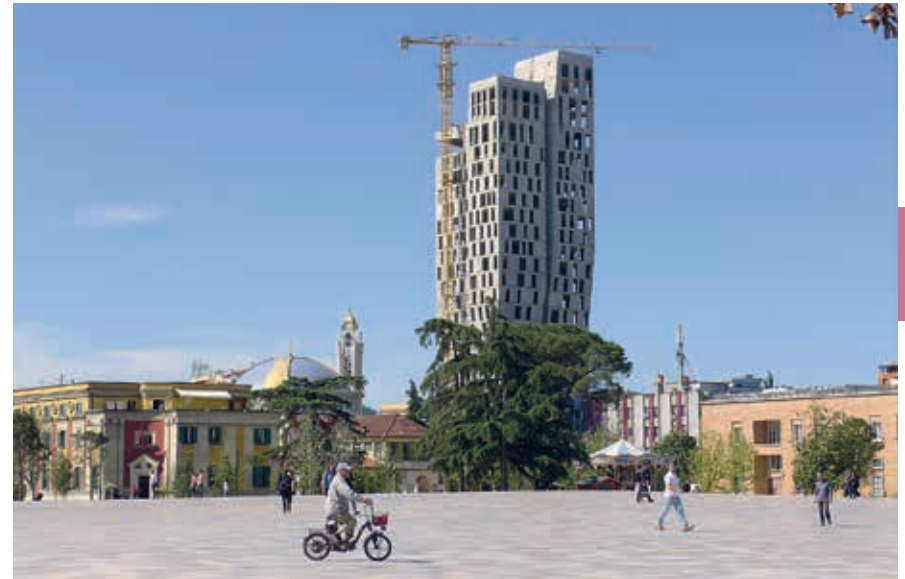
Het in 2017 opgeknapte Skanderbegplein, met uitzicht op de 4Evergreen-toren in aanbouw.