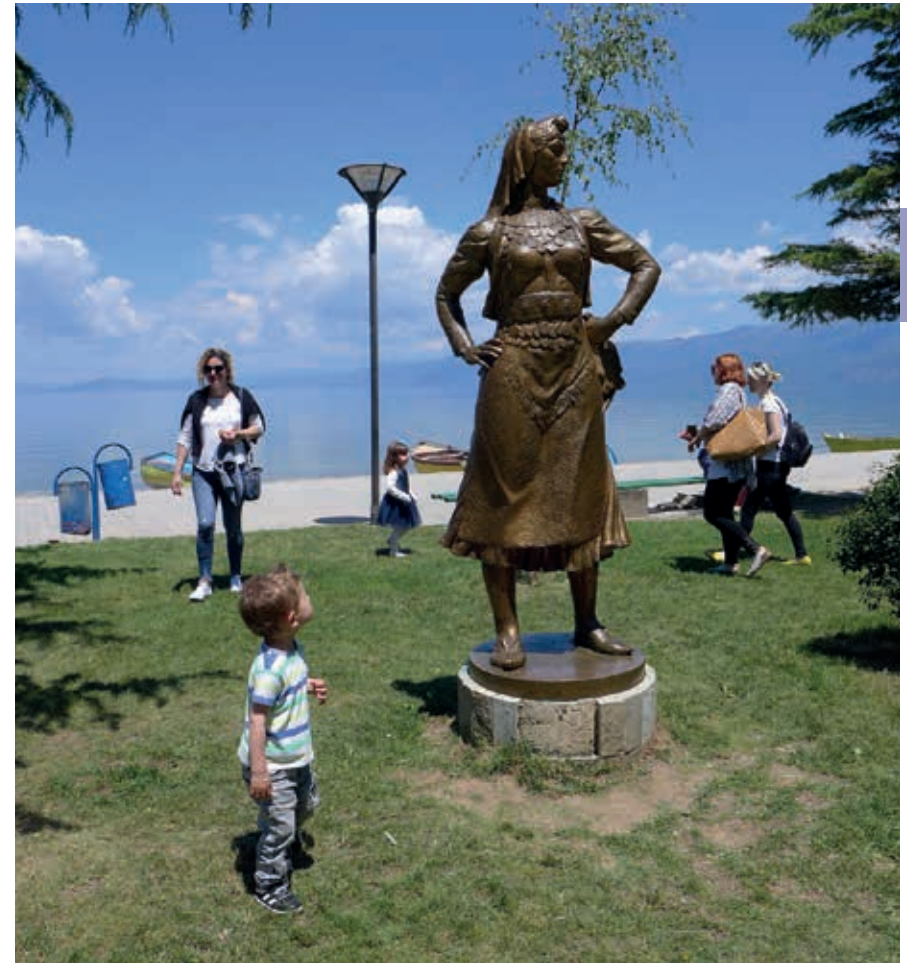
Het Meer van Ohrid bij Pogradec.

Het zal tot tegen 2021 niet makkelijk zijn om bij de tombes te komen. Elke middag vertrekt er wel een minibus uit Pogradec. Deze gaat langs Lin en de pas van Thanë, slaat vervolgens bij Urakë naar het zuiden af om steil te klimmen langs smalle gravelpaden tot het gehuchtje Kriçkove, waarvandaan je naar de tombes kunt lopen. Het busje keert daar echter ook weer om en gaat terug naar Pogradec, om pas de volgende dag weer omhoog te komen. Ook de weg langs Propriht waarvandaan je zou kunnen lopen, is op het moment van verschijnen van deze gids te slecht. Een bezoek is nu dus alleen mogelijk als je een taxi vindt die het aandurft erheen te gaan of als je bereid