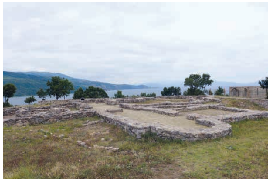
De deels gereconstrueerde basiliek in Lin, met uitzicht op het Meer van Ohrid.

Librazhd, aan de oever van de Shkumbin, was in die communistische tijd een belangrijk centrum voor producenten van alcoholische dranken. Tegenwoordig zie je er vooral touroperators en reisbureaus, waarschijnlijk omdat de plaats op de doorgaande route naar Noord-Macedonië en Griekenland ligt. Përrenjas, zo'n 30 km verder, is de laatste plaats langs de SH3 vóór de pas van Thanë , die de bergen van Jablanica in het noorden scheidt van de bergen van Mokra in het zuiden. De stad ligt op bijna 550 m hoogte in een door bergen omgeven vlakte. In dit gebied werd vroeger al ijzer en nikkel gewonnen in ondergrondse en open groeves. De communisten bouwden er grote fabrieken omheen in de jaren 60, maar de capaciteit werd nooit volledig benut. Met het verdwijnen van de staalindustrie in Elbasan zijn de fabrieken nog voor hun bloei in verval geraakt. Hier en daar zie je de skeletten nog.