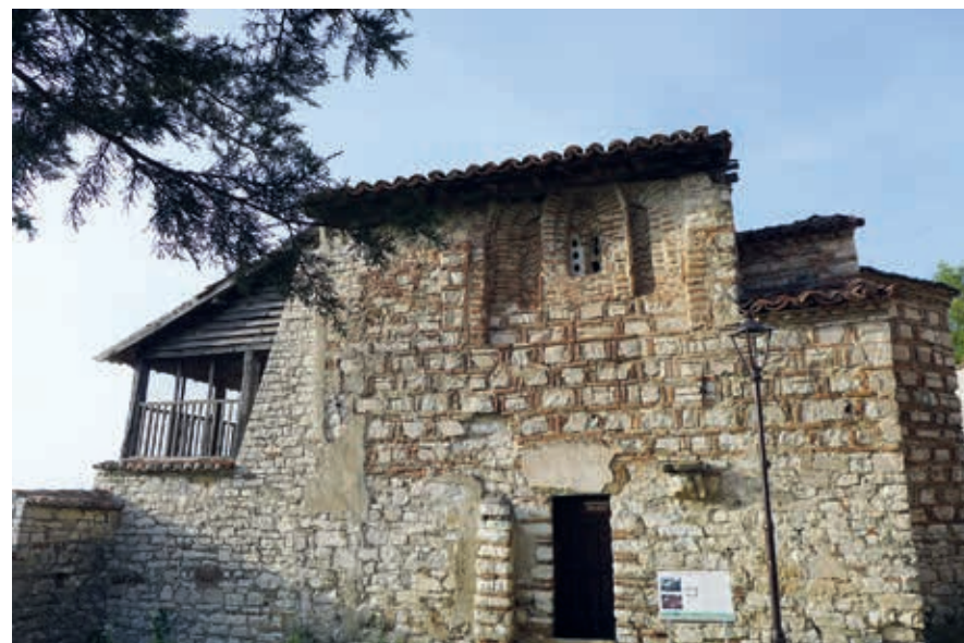
De oudste kerk van Berat kreeg haar naam Mary Vllaherna na de overwinning op de Angevijnen.

De Romeinen beheersten het gebied dat nu Albanië heet vanaf ongeveer 150 v.Chr. Ze noemden het de provincie Illyricum. Met de aanleg van verharde wegen gaven ze de handel een sterke impuls, en ook hun kennis bracht welvaart en bloei. In grote steden werden academies gesticht, die latere beroemdheden hebben voortgebracht. Zo studeerde Octavianus, de eerste keizer van het Romeinse Rijk, in Apollonia, aan de monding van de Vjosë. Rond het jaar 150, onder keizer Trajanus, strekte het Romeinse Rijk zich uit over het hele gebied rond de Middellandse Zee en naar boven tot halverwege Nederland. Daarna begon de langzame val in een opeenvolging van oorlogen en twisten.