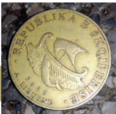
Albanië verwijst graag naar het maritiem verleden van de Illyriërs.