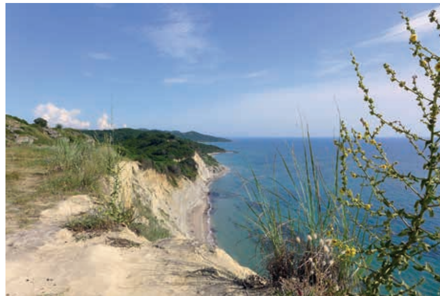
Klif bij de Kaap van Rodon, waar oeverzwaluwen hun nesten maken.

Naast de prachtige berggebieden bepalen kust en water een belangrijk deel van wat Albanië voor toeristen aantrekkelijk maakt. De kust heeft een lengte van 362 km en is zeer gevarieerd. Van kilometerslange zandstranden zoals bij Velipojë en Shëngjin in het noorden tot de fijne grind- en rotsbaaitjes net onder Vlorë en trendy strandresorts nog wat verder naar het zuiden. Waar de moerassige kustvlaktes tot de zee reiken, zijn de rotswanden soms hoog en steil, zoals bij de magnifieke Kaap van Rodon (zie p. 14 voor een overzicht). Bijna 5% van de Albanese oppervlakte bestaat uit water. Smeltwater uit de bergen zorgt in het voorjaar regelmatig voor overstromingen in de lagere gebieden. Grote meren zijn het Meer van Shkodër in het noorden en het Meer van Ohrid in het zuidoosten. Belangrijke rivieren zijn de Drin, de Mat, de Shkumbin, de Vjosë en de Seman. De meeste zijn door een sterk wisselende watertoevoer onbevaarbaar, behalve op de plaatsen waar dammen zijn aangelegd, zoals bij het Komanmeer, een stuwmeer van de Drin. Op bepaalde