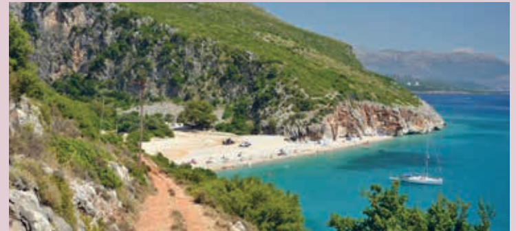
Het strand van Gjiçë.

De rustigste stranden aan de Albanese Riviëra anno 2020 waren Gjiçë en Jalë bij Vuno, Potam bij Himarë, Borsh, Bunec bij Piqueras, Lukovë, Coco bij Sarandë, Pema e Thatë bij Ksamil en Mango bij Butrint. In de regel geldt: hoe moeilijker het is om er te komen, hoe groter je kans op de perfecte strandidylle. Informeer zo mogelijk van tevoren of de weg te doen is.