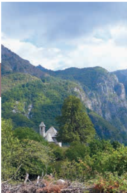
De iconische kerk van Teth.

de Theth, met een lichte concentratie net over de brug, in Qendra (Centrum). Veel van de huizen zijn de laatste jaren tot gastenverblijven omgebouwd. In 2020 staan er daar nog steeds een stuk of 30 van, maar de chaletachtige gebouwen die tegelijkertijd verrijzen, zijn een waarschuwing dat Theth mogelijk gauw het nu zo charmante pionierstoe-risme ontgroeien zal.