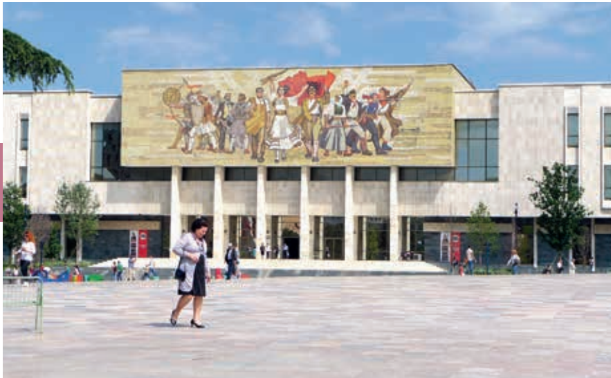
Het Nationaal Historisch Museum.