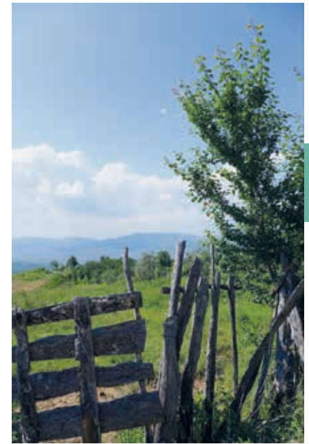
Pittoresk landschap bij Shelcan. Ga je niet voor de fresco's, dan zou je voor het heerlijke uitzicht kunnen gaan.

➤ ETNOGRAFISCH MUSEUM. Geopend: ma.-vr. 9–14.30 uur. Rruga Sul Misiri.