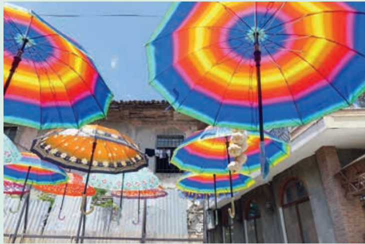
Versiering in de oude stad van Elbasan.