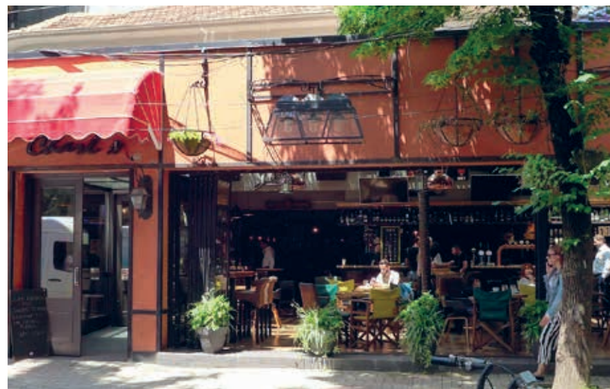
Een van de vele restaurants in de wijk Blloku.

> Nouvelle Vague, helder, kleurrijk en eigenzinnig, Rruga Pjetër Bogdani, open dag. 11-2 uur.