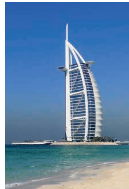
Burj Al Arab, het icoon van Dubai.

Kroonjuweel en een van de meest gefotografeerde locaties in Jumeirah is ontegenzeggelijk Burj Al Arab, het luxehotel bij uitstek, ontworpen in de vorm van een bollend scheepszeil. De rijzige toren (321 m) staat op een kunst-