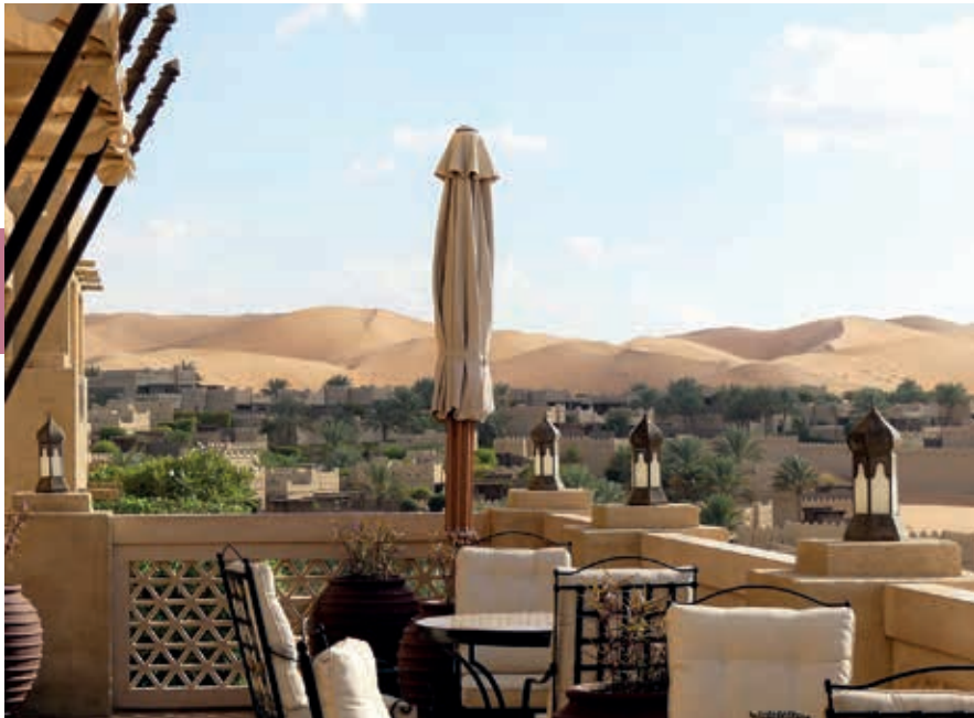
Het luxe vijfsterrenhotel Qasr al-Sarab in de Liwa-oase.

Het Manarat Al Saadiyat -kunstencentrum biedt ruimte aan tijdelijke tentoonstellingen. Er is een leuk museumcafé. Het nabijgelegen UAE-paviljoen in de vorm van zandduinen was een groot succes op de Wereldtentoonstelling Shanghai 2010. Het is van de hand van Foster & Partners en als evenementenlocatie in gebruik.