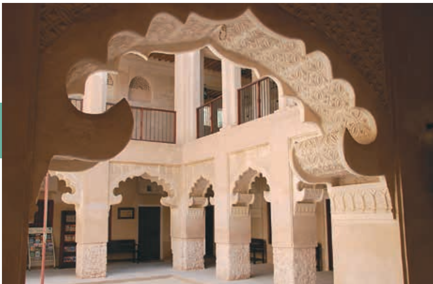
De sfeervolle Ahmadiya-school in Dubai.

edelstenen, diamanten en parels. Vooral tussen 16 en 22 uur komen kooplustigen een kijkje nemen.