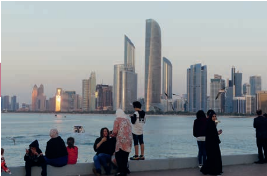
De zachte gloed van de ondergaande zon kleurt de Corniche van Abu Dhabi oranje-rood.

standen in de stad zijn bedrieglijk, want veel groter dan verwacht. Voor een stadsbezoek kun je, wanneer je niet over eigen vervoer beschikt, het beste een taxi of een stadsbus nemen.