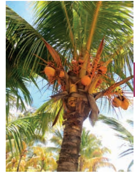
Kokospalmen groeien in nature alleen in tropische gebieden. In Oman vind je ze in het zuiden, in Dhofar.

De zuidelijke uitlopers van het Hadjargebergte gaan geleidelijk over in een 500 km lange kiezelvlakte, de Jiddat al-Harasis. Ten oosten van dit gebergte ligt de 16.000 km 2 grote Wahiba-zandwoestijn. Ten westen ligt de immense, bijna ondoordringbare Rub al-Khali-woestijn, die overgaat in het grondgebied van Saoedi-Arabië. In het zuiden, in Dhofar, vormt het Dhofargebergte met de bergketens Jebel al-Qara (1500 m), Jebel Qamar en Jebel Samhan een baken tussen de woestijn en de smalle kustvlakte van Salalah, gren-