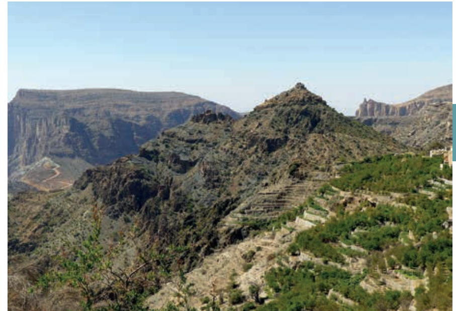
Terrasbouw op 2000 m hoogte in Jebel Akhdar.

Ca. 7 km van Fanja ligt Bidbid, vroeger strategisch gelegen nabij de kruising van oude karavaanwegen uit het zuiden (Nizwa, Salalah), het oosten (Ibra, Sur) en het noorden (Muscat). Deze belangrijke controlepost had uiteraard een verdedigingsfort. Dat ligt ca. 1 km van de snelweg, aan de rand van Bidbid, nabij de wadi. Het is het eerste fort in Oman dat werd gerestaureerd volgens de strikte regels van de traditionele bouw. Het is echter niet toegankelijk. De falaj naast het fort is nog in gebruik door de plaatselijke bevolking.