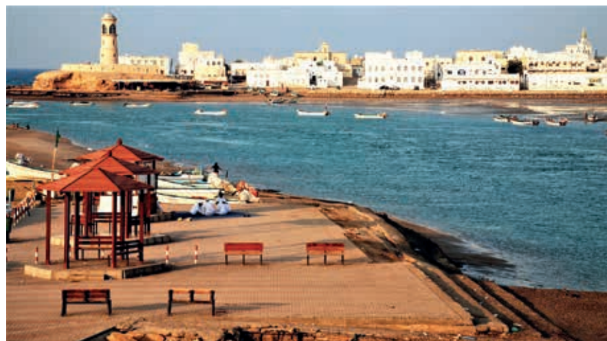
Sur, de belangrijkste stad aan de oostkust van Oman.

Qalhat is de volgende stop. Het is moeilijk voorstelbaar dat dit vissersdorp een belangrijk verleden met zich meedraagt. De historische wortels van het dorpje gaan terug tot de 2de eeuw n.Chr. Vanaf het einde van de 12de eeuw ontpopte Qalhat zich tot een belangrijk zeehandelscentrum, met zijn grootste bloeiperiode een eeuw later, onder de heerschappij van Hormuz. Verhalen van vroegere reizigers, onder wie Marco Polo en Ibn Battuta, weerspiegelen deze welvarende periode. Geschonden door een hevige aardbeving in de 15de eeuw en verwoest door een Portugese inval in 1507 verzonk Qalhat in het niets. Slechts schaarse overblijfselen bleven overeind. Recente