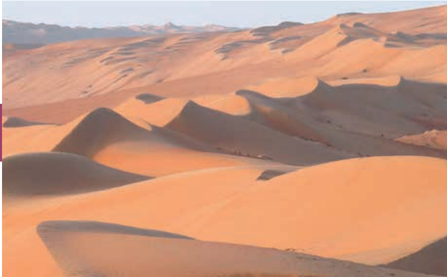
De Wahiba-zandwoestijn in Oman.