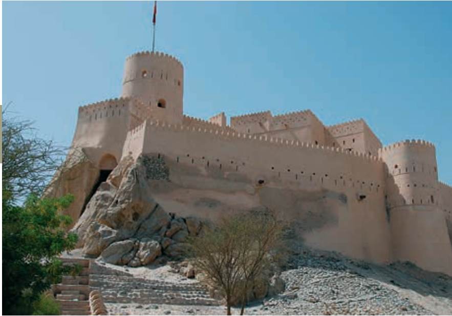
Het fort van Nakhl.

De aantrekkelijke weg richting Nakhl loopt door de Batinah-kustvlakte naar de bergen. De warme kleur van het gebergte verandert in het zonlicht.