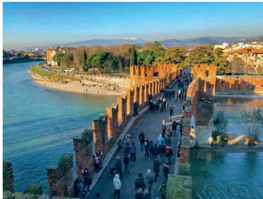
Ponte di Castelvecchio.

De Corso Cavour, die vanaf Castelvecchio naar het hart van het historische centrum loopt, was onderdeel van de Romeinse Via Postumia, de route tussen Genua en Aquileia en hier tevens de belangrijkste toegangsweg tot de klassieke stad. Aan het begin bij Castelvecchio getuigt de Arco dei Gavi van het Romeinse verleden. De poort markeerde vanaf de 1ste eeuw v.Chr. het begin van het deel van de Via Postumia dat de stad in liep. In de middeleeuwen werd de poort opgenomen in de stadsmuren die in die tijd gebouwd werden. Franse troepen van Napoleon braken de poort echter af, maar in 1932 werd hij met oorspronkelijke stenen gereconstrueerd op last van Mussolini, die de grootsheid van het Romeinse Rijk wilde doen herleven ter