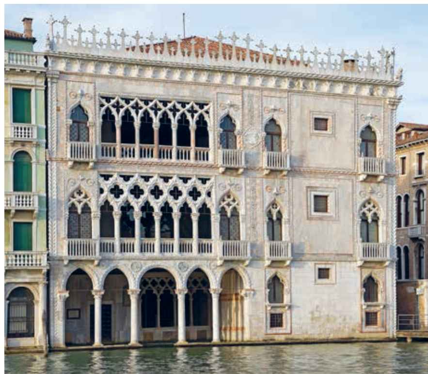
Façade van het Ca' d'Oro.

De laatste particuliere eigenaar, baron Giorgio Franchetti, liet het palazzo bij zijn overlijden in 1922 na aan de staat, samen met de collectie kunst en antiek die hij bij leven bijeen had gekocht. In de Galleria Giorgio Franchetti, op de eerste en tweede verdieping van het Ca' d'Oro, kun je nu bekijken wat zijn verzamelwoede zoal opleverde: bijvoorbeeld een schilderij van Titiaan van Venus met spiegel, en een doek van Andrea Mantegna waarop Sint-Sebastiaan het zwaar te verduren heeft; het lichaam van de martelaar is getroffen door een tiental pijlen. Hij is na zijn dood dan ook beschermheilige