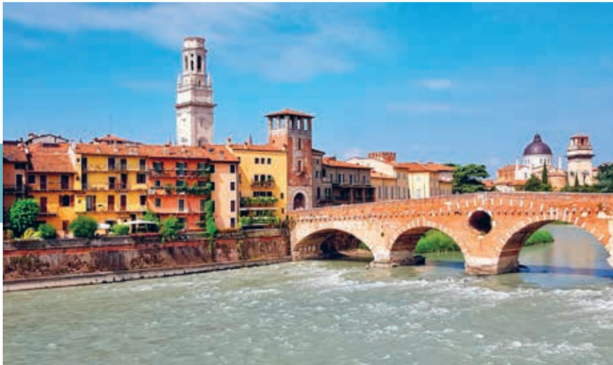
De Ponte Pietra stamt uit Romeinse tijden.

stad over in de Noord-Italiaanse laagvlakte; al het bezienswaardigs bevindt zich ten noorden van het station.