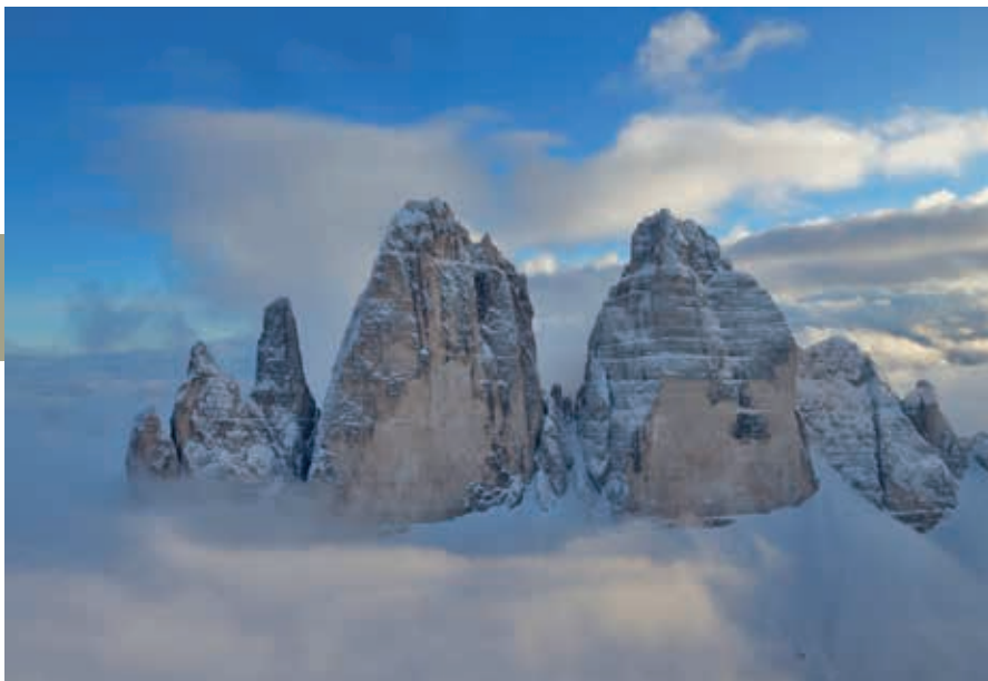
Tre Cime di Lavaredo.

Auronzo en de grote parkeerplaats ernaast, op 2320 m hoogte. Vanaf de berghut loopt wandelroute 101 langs het rotsbastion met de drie centrale pieken, die je in circa anderhalf uur lopen via Rifugio Lavaredo naar de Dreizinnenhütte aan de noordkant voert. Vandaar kun je dezelfde weg terug of ervoor kiezen de langere route 105 langs de westzijde te volgen, die na een laatste steile afdaling weer bij Rifugio Auronzo uitkomt. Tijdens het wandelen in het prachtige berggebied kun je zien dat de drie pieken omringd worden door nog veel meer grillige toppen; het geheel ziet er een beetje uit als de Zwarte Bergen zoals Marten Toonder die in zijn Bommelverhalen tekende. In de Eerste Wereldoorlog is ook hier trouwens flink gevochten; er zijn nog wat resten van Italiaanse stellingen te zien.