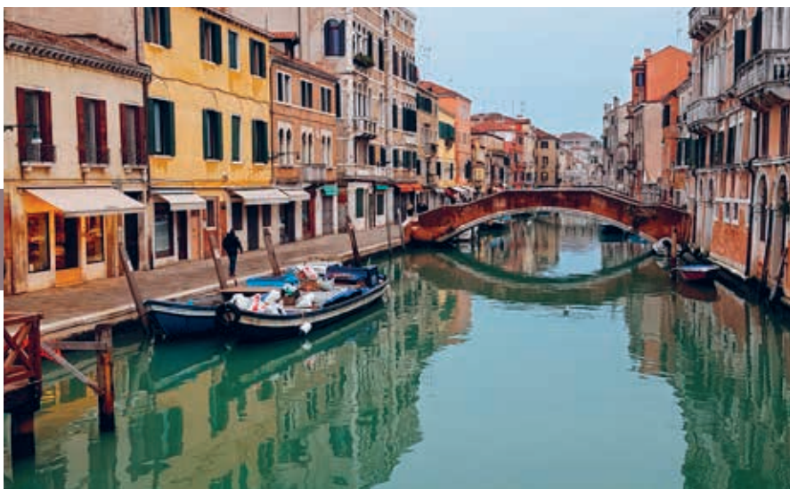
Stille wateren in Cannaregio.

Laatste Oordeel. Ook zijn schilderende zoon Domenico, en Cima da Conegliano en Palma de Jongere zijn in de kerk vertegenwoordigd. Tintoretto zelf heeft tot de Dag des Oordeels zijn laatste rustplaats gevonden in de kapel rechts van het koor.