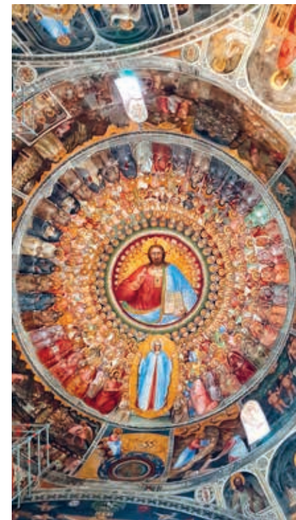
Fresco's in de doopkapel bij de kathedraal.

Net even ten zuidwesten van Piazza dei Signori ligt Piazza Duomo, waar de Duomo di Padua staat (officieel de Basilica Cattedrale di Santa Maria Assunta). De domkerk is de derde kathedraal op deze plaats, gebouwd tussen 1551 en 1754; de voorgevel is echter nooit helemaal volgens de bouwplannen voltooid en ziet er daardoor een beetje uit als een blinde gevel. Binnen kun je onder meer werk zien van Francesco Bassano de Jongere, zoon van Jacopo Bassano. De romaanse doopkapel bij de kathedraal, de Battistero di San Giovanni Battista (Doopkapel van Johannes de Doper) stamt uit de