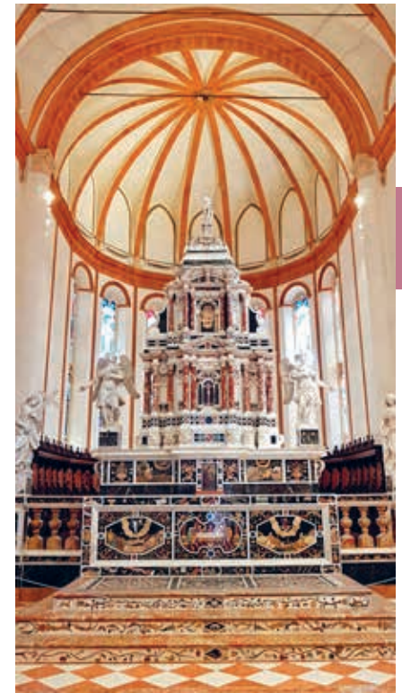
Interieur van de kathedraal van Vicenza.

Tegenover de Basilica Palladio is de Loggia del Capitano uit 1572 eveneens een monument waar Palladio de hand in heeft gehad, wat je bijvoorbeeld kunt zien aan de vier zuilen met Korinthische kapitelen. Het is de voorzijde van het Palazzo del Capitaniato , destijds de officiële residentie van de bestuurder die het militaire gezag van Venetië vertegenwoordigde. In tegenstelling tot de Basilica aan de overzijde van het plein liet Palladio de loggia met veel stucwerk decoreren. Tegenwoordig zetelt het stadsbestuur in het gebouw.