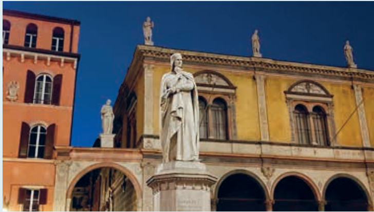
Het beeld van Dante op Piazza del Signori.