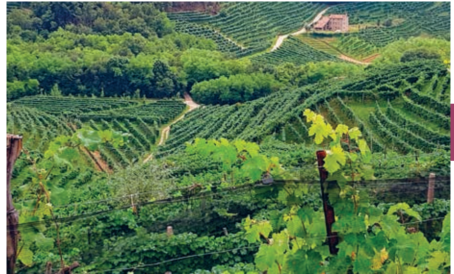
'Proseccoheuvels' ten oosten van Valdobbiadene.

De regio Veneto, het vroegere kerngebied van de republiek Venetië, grenst aan de west- en zuidkant aan de regio's Lombardia, Trentino-Alto Adige en Emilia-Romagna. In het noorden is een klein stukje grens met Oostenrijk, aan de oostzijde ligt Friuli-Venezia Giulia. Het gebied is onderverdeeld in zeven provincies: Verona, Vicenza, Padua, Rovigo, Venetië, Treviso en Belluno.