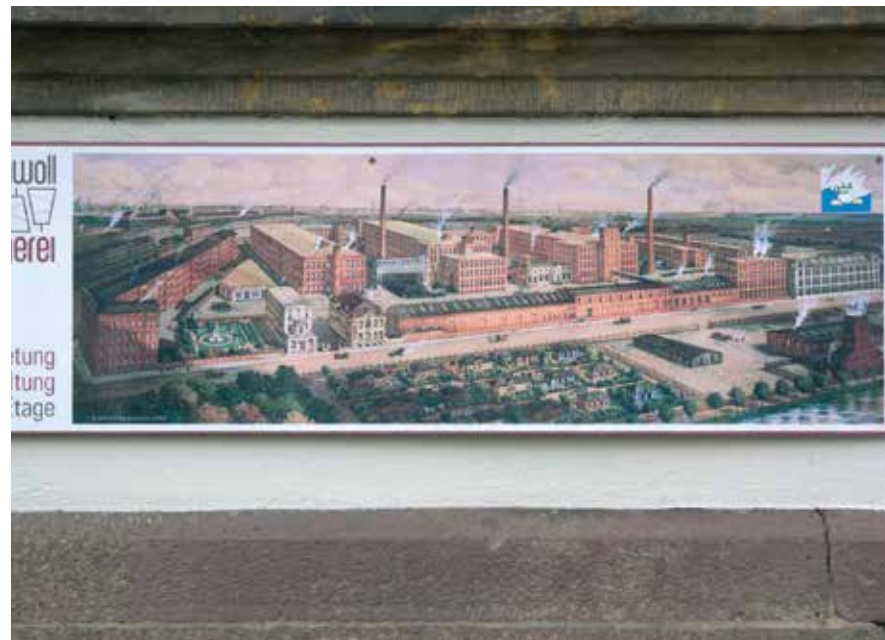
De Spinnerei in de 19de eeuw.

De Spinnerei (voluit: Leipziger Baumwollspinnerei) is een grote katoenfabriek die verbouwd is tot atelierruimte voor kunstenaars en andere zelfstandigen. Ook zijn er galleries, een winkel/groothandel voor kunstenaarsbenodigdheden, een pension en (’s zomers) een Biergarten. Enkele kunstenaars van de