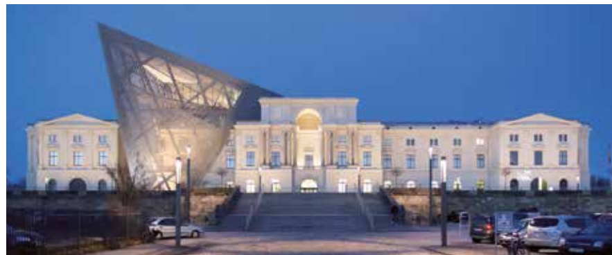
Architect Daniel Libeskind combineerde in het nieuwe Militair-Historische Museum spectaculaire 21ste-eeuwse met imponerende klassieke architectuur.

De grootste attractie van de Albertstadt is het volledig gemoderniseerde Militair-historisch museum van het Duitse leger . Het is gevestigd in een groot 19de-eeuws arsenaal. Dat is radicaal verbouwd naar een spectaculair ontwerp van de bekende architect Daniel Libeskind, die een grote glazen wig in het gebouw plaatste. Deze wig verwijst naar de formatie van de bommenwerpers van 13 februari 1945 en ook naar de plaats waar de eerste