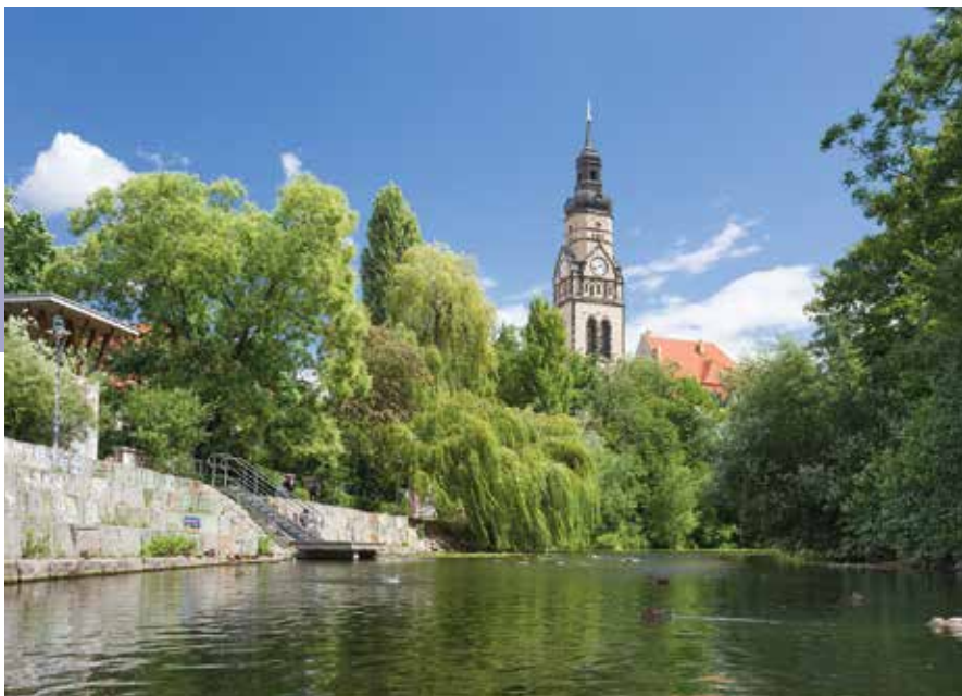
De Elster, heel geschikt om te kanoën, te kajakken of te roeien.