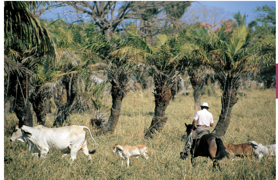
De provincie met de mooie naam Guanacaste is het land van de savanne en de sabaneros , de Costa Ricaanse cowboys.

Het nevelwoud gedijt op de hellingen van de cordilleras, waar warme opstijgende lucht uit de Caribische laagvlakten condenseert. Deze bossen liggen in een gematigde klimaatzone en zijn vaak permanent in wolken gehuld. Door de hoge vochtigheid is de flora in het nevelwoud erg uitbundig en gevarieerd. Op 1 ha kunnen 100 verschillende plantensoorten voorkomen. In tegenstelling tot het regenwoud is de onderste etage dichtbegroeid en zijn de bomen iets minder hoog. Opvallend zijn de talrijke soorten epifyten (gastplanten), varens en mossen. Een van de opmerkelijkste kruidachtige