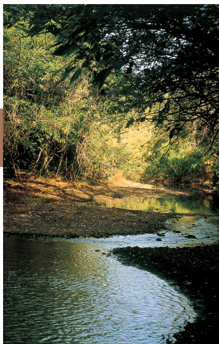
Impressie van Nationaal Park Corcovado.