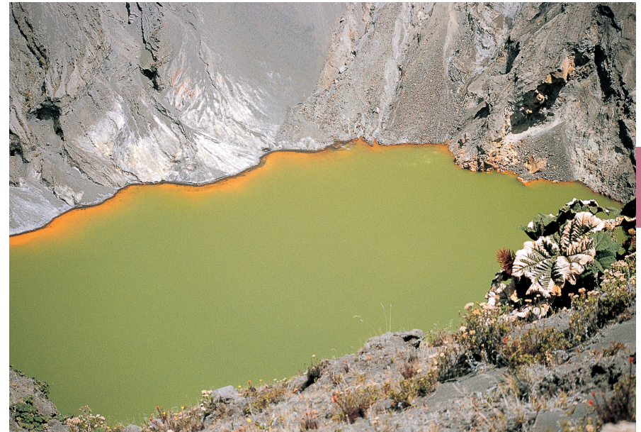
Het gifgroene kratermeer van de vulkaan Poás.

Costa Rica bezit een reeks imposante vulkanen, maar Poás behoort beslist tot de spectaculairste. Poás is een slapende vulkaan met een hoogte van ruim 2700 m. De laatste uitbarsting vond plaats in 1910. Naar verluidt hing toen een kilometers hoge wolk van hete gassen, as en stenen boven de Poás en zijn omgeving. Sinds die heftige uitbarsting zijn alleen nog kleine erupties en onderaardse activiteiten gesignaleerd. De gestolde lava bij de krater is een zichtbaar spoor van die jonge, onschuldige uitbarstingen.