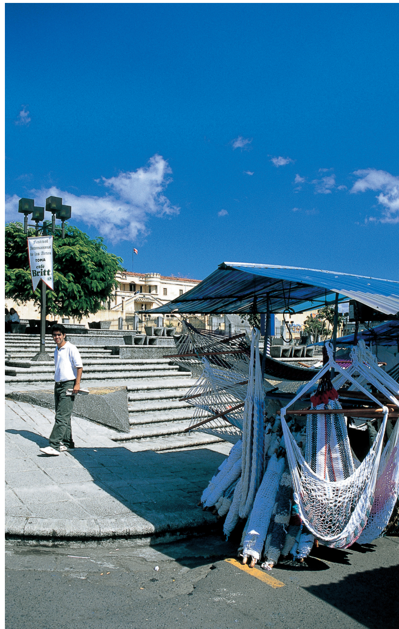
Plaza Democracia, aan de oostkant van het centrum, een van de adresjes om een hangmat te kopen.