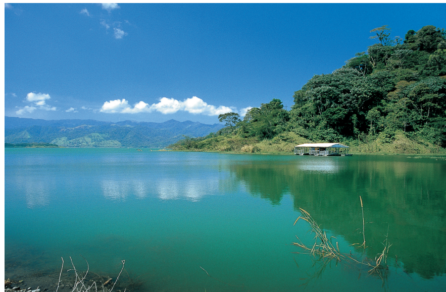
Laguna de Arenal.

De Laguna de Arenal ligt op een hoogte van 500 tot 600 m en is het grootste meer van Costa Rica. Wolken spiegelen zich als donkere vlekken in het water. Deze grillige vormen moeten de mensen in de omgeving hebben geïnspireerd tot verhalen over watermonsters. Als we die verhalen mogen geloven, spookt er familie van het monster van Loch Ness rond op de bodem van de Laguna de Arenal. Bergen omringen het meer. De hellingen zijn deels