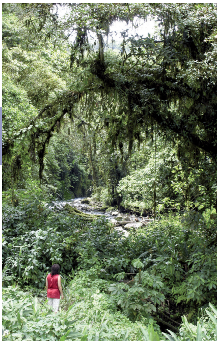
Wandeling in de regio Monteverde.