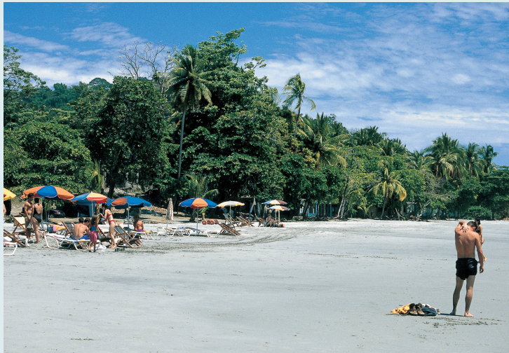
Spaans leren aan het strand van Manuel Antonio.