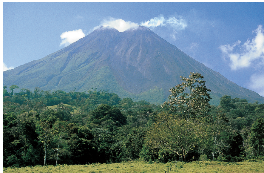
Vulkanen behoren tot de topattracties van Costa Rica, zoals de afgebeelde vulkaan Arenal.

Het noordelijke bergland is vulkanisch en vormt een onderdeel van een lange reeks vulkanen die van het noorden van Californië tot aan het zuiden van Chili loopt. In Costa Rica komen voornamelijk stratovulkanen voor. Kenmerkend voor dit type vulkaan, waarvan de Vesuvius het bekendste voorbeeld is, is de kegelvorm en de eventuele hevige erupties. Meestal be-