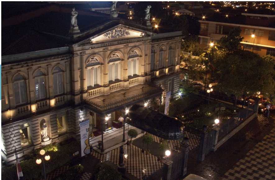
San José by night.