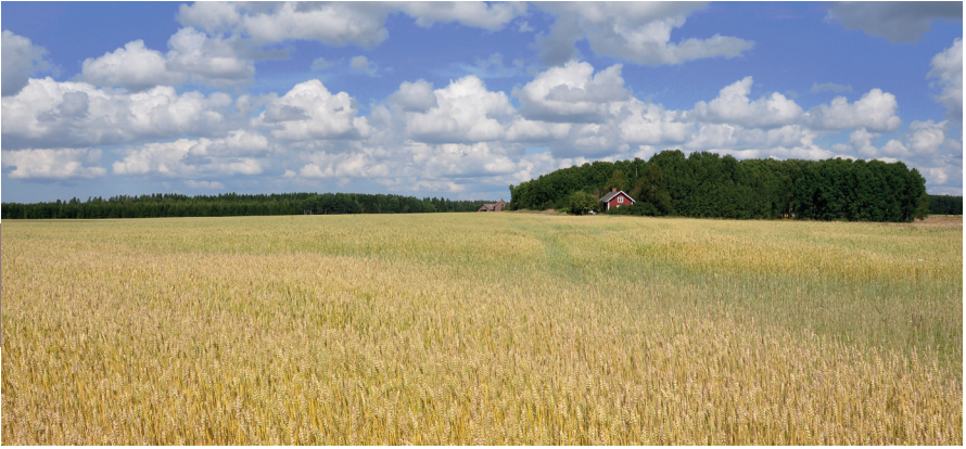
De korenvelden van Skaraborg.