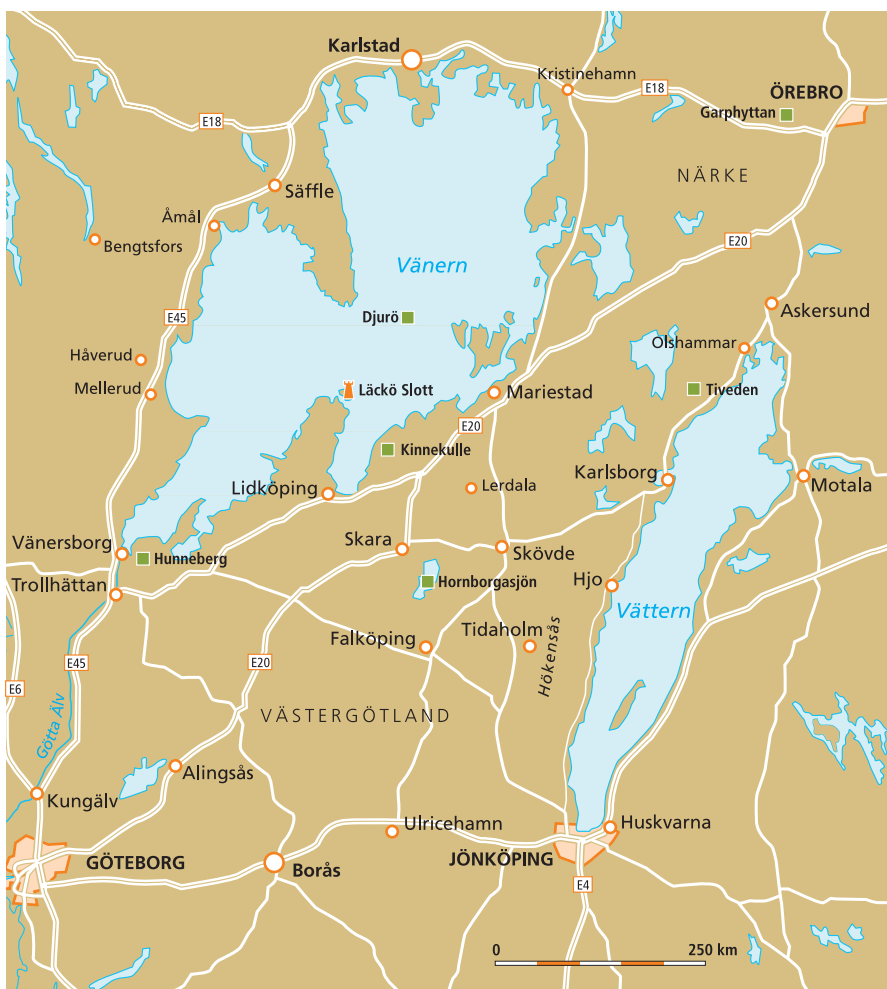
Tussen de meren Vänern en Vättern

jacht geopend, Älgens Berg, met onder meer een permanente expositie van het werk van de natuurschilder Gunnar Bruswitz.