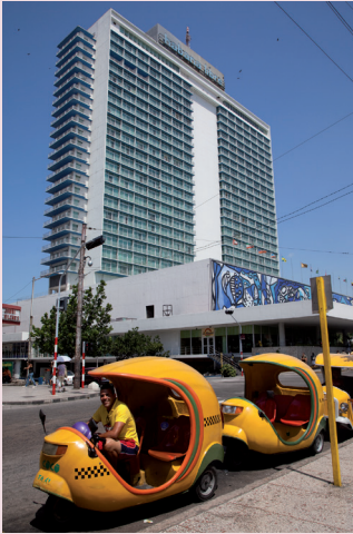
Hotel Habana Libre in Vedado, landmark in het moderne deel van de stad.