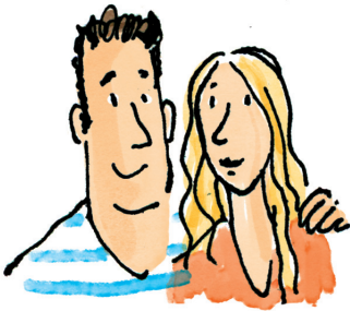
De ouders van Wies

De oma van Wies. Ze woont in Huize Grijsoord. Ze is dol op make-up en op mode.