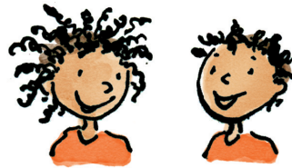
Zane en Jazz

Helpers (of ritselaars). Ze zijn altijd op reis, ze hebben veel geheimen en ze zijn dol op champagne.