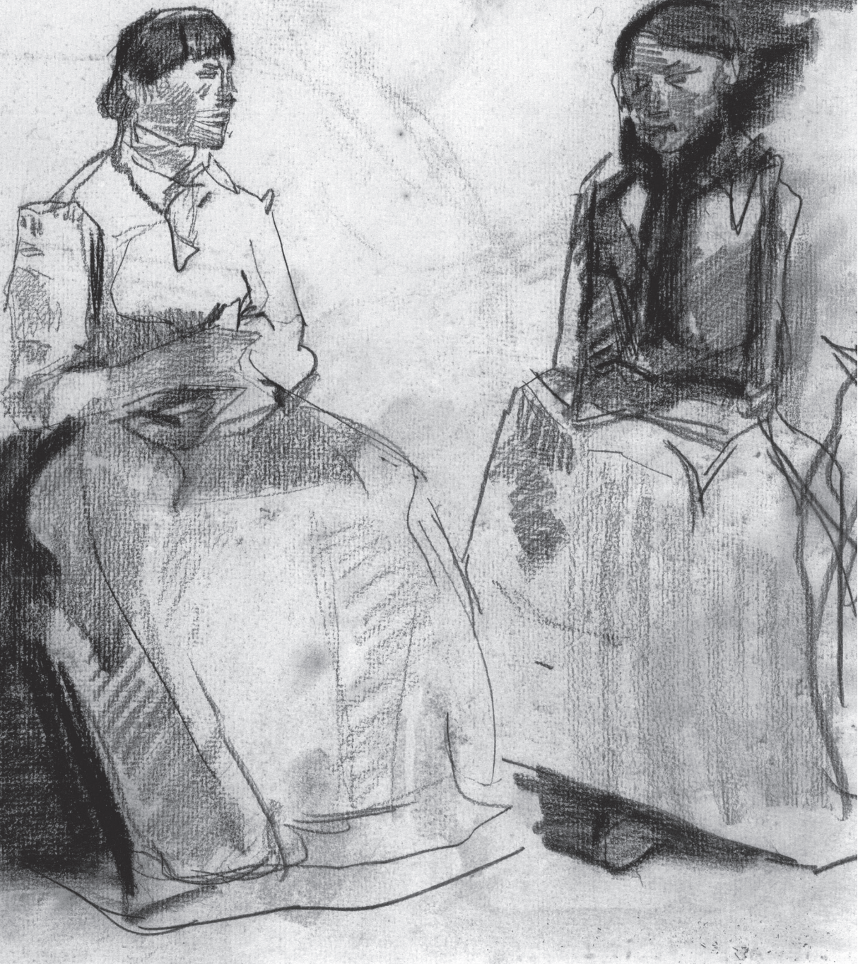
Tussen 1792 en 1798 werden in Amsterdam vijf processen gevoerd tegen in totaal dertien vrouwen die ervan werden beschuldigd enigerlei vleselijke gemeenschap met elkaar te hebben gehad (uit: Ziel en zinnen)