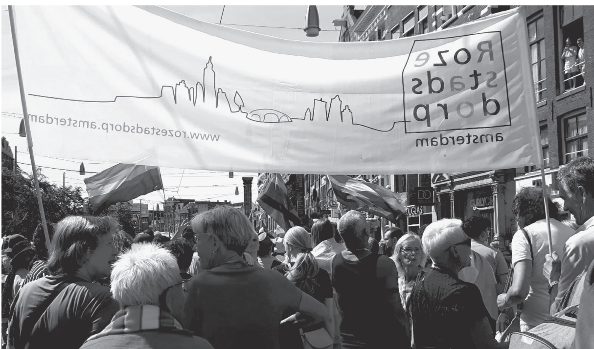
Rozestad dorpers tijdens de Pride Walk, 2022