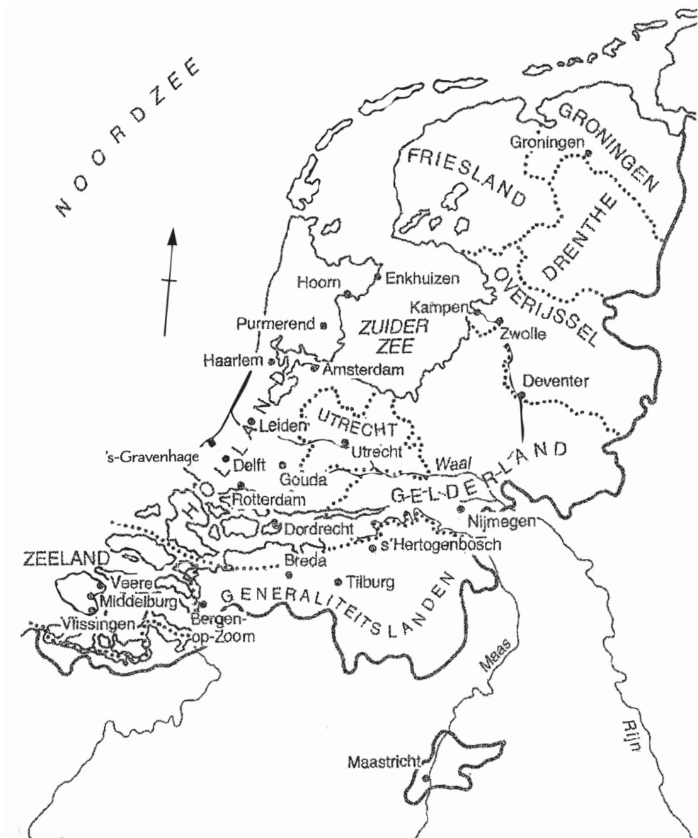
De Republiek omstreeks 1650.