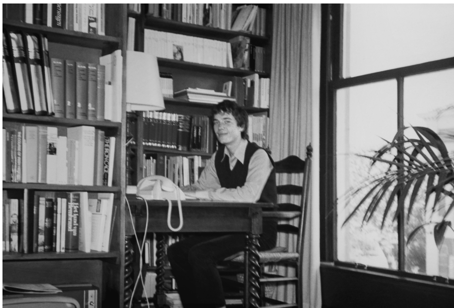
Appartement Plantage Kerklaan 43, Amsterdam – 1970.