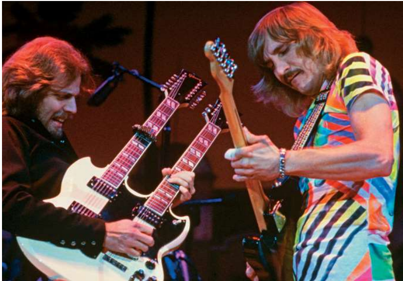
The Forum, Inglewood, Californië, 4 maart 1980

zijn en beseffen dat ze kritisch zullen worden benaderd. In december 1976 komt Hotel California dan eindelijk uit. Pers en publiek zijn laaiend enthousiast.