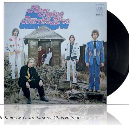
Chris Ethridge, Sneaky Pete Kleinow, Gram Parsons, Chris Hillman