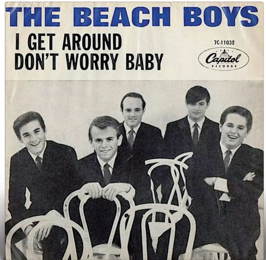
I Get Around.

De echte doorbraak volgt in 1963 met Surfin' U.S.A. Met deze catchy song is de landelijke doorbraak een feit. Brian Wilson, zelf totaal geen surfer, laat een lijst opstellen met de beste surflocaties en verwerkt deze in dit lied, dat hij van Chuck Berry's Sweet Little Sixteen 'leende' en waar hij meerstemmige vocalen aan toevoegde.