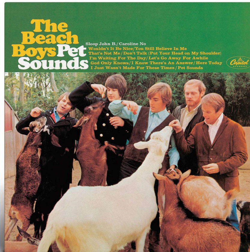
De hoesfoto is geschoten in de San Diego Zoo.

In 1966 verschijnt Pet Sounds , een album dat critici classificeren als een muzikaal hoogstandje dat kan wedijveren met het werk van dat bandje uit Liverpool. En dat is precies wat Brian wil: een album maken zo goed als Rubber Soul .