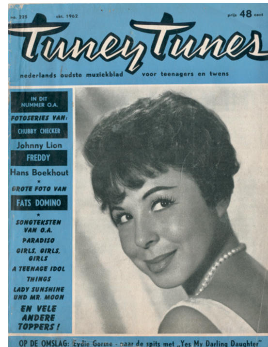
Tuney Tunes no. 225, 1962

Uiteraard was een dergelijke uitgave niet naar de zin van de Duitse bezetters. Het tijdschrift verscheen dan ook illegaal. Het was een klein blaadje van slechts enkele pagina's, met een niet geringe oplage van zo'n 4 à 5.000 exemplaren. De maandelijkse verschijning werd na een geallieerd bombardement op Eindhoven in december 1942, waarbij de drukkerij getroffen werd, tijdelijk gestaakt. In januari 1943 verscheen T.T. weer, maar een volgend bombardement in maart 1943 deed Van Haaren besluiten voorlopig opnieuw te stoppen. Maar meteen na de bevrijding van Zuid-Nederland in september 1944 was T.T. er weer.