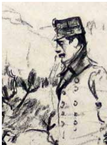
Detail zwart krijt tekening zie pagina 57