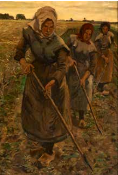
Drie schoffelende vrouwen