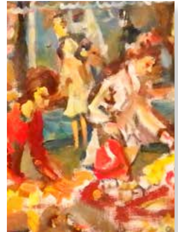
Detail olieverf op doek zie pagina 33