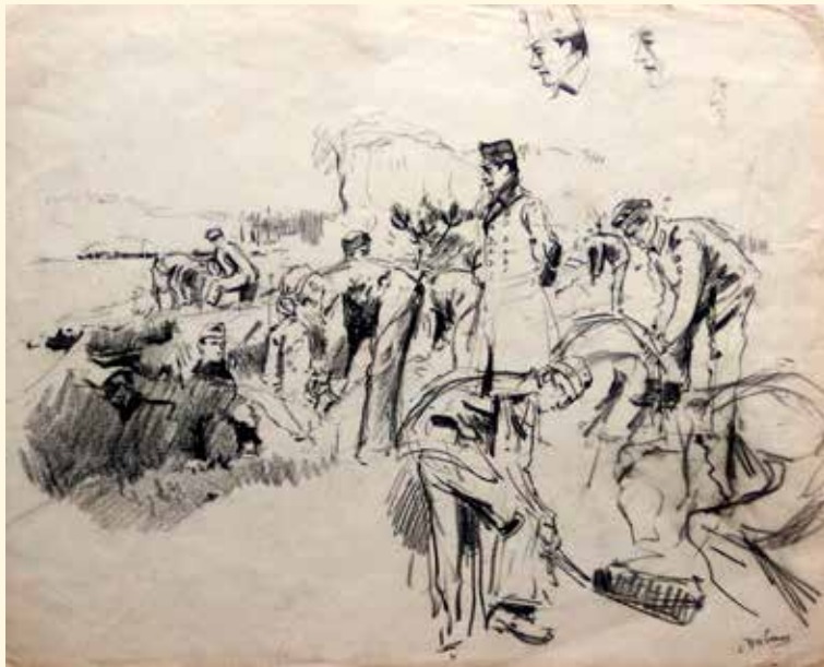
Tankval graven bij Zuidlaren (nr. 2)