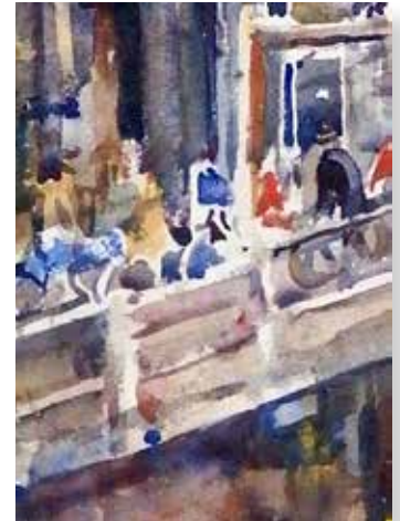
Detail aquarel zie pagina 31