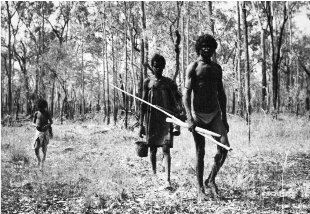
Foto van een Australisch Aboriginal-gezin, gemaakt door Axel Poignant omstreeks 1950.

De vrouw is minder snel en sterk dan de man, zeker als ze zwanger is of een klein kind bij zich draagt. Daarom loopt ze achter de man die haar met zijn wapens ook kan beschermen. In haar handen en op haar rug draagt zij allerlei huisraad. In het geval van deze foto zijn daar ook een modern emmertje en een blik bij, waaruit blijkt dat deze mensen in aanraking zijn geweest met de industriële samenleving van Australië. Dit vaatwerk is handig voor het opslaan en meenemen van verzamelde vruchten en zaden. Het beperkt echter ook de afstand die het gezin kan afleggen: hoe meer er mee te dragen is, des te langzamer wordt er gelopen. Op de foto is de gebruikelijke rolverdeling in samenlevingen van jager-verzamelaars goed te zien: de man is de jager en de vrouw de verzamelaar.