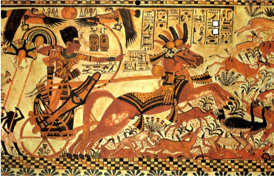
Toetanchamon op jacht. Deksel van een beschilderd kistje uit het graf van Toetanchamon, omstreeks 1360 v.C.

“De goede god, de zoon van Ra, levend beeld van Amon, heerser van Thebe, besteeg zijn tweespan. Zijne Majesteit vond grote kudden wilde dieren van de woestijn en ving ze in een oogwenk.”