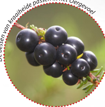
De bessen van kraaiheide passen in het Oergevoel

Dit boek wijst de lezer de weg. Het is een gids die de talloze bewijzen benoemt van Drenthe als Oerprovincie. Niet alleen de opvallende en (over)bekende elementen in het landschap, zoals hunebedden, plaggenhutten en de schaapskuddes op de paarse heide, maar ook de vele andere landschappelijke, geologische en archeologische tekens van de Drentse (pre)historie. Want iedereen kent de hunebedden, maar pingoruïnes zijn minstens even karakte-