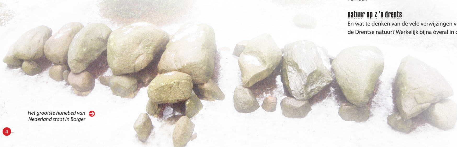
Het grootste hunebed van Nederland staat in Borger →