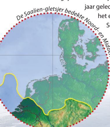
De Saalien-gletsjer bedekte Noord- en Midden-Nederland