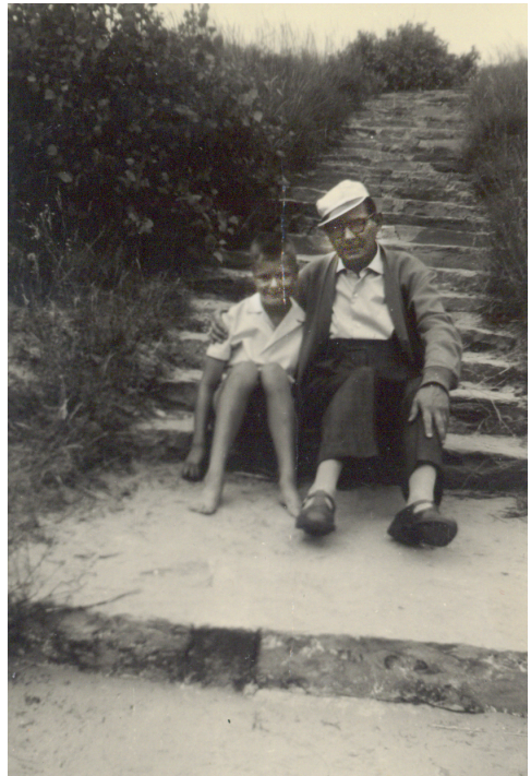
Rond 1960 met mijn vader