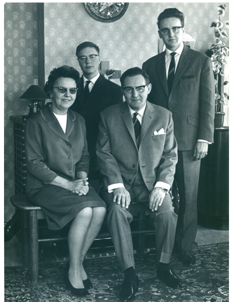
De familie Merhottein midden jaren 60

Maar dan toch echt wel onderaan. Mijn vader verdiende de kost, mijn moeder deed het huishouden. Wij woonden in die tijd bij mijn grootvader in. Mijn vader was bediende bij de Antwerpse gasmaatschappij, hij was encaisseur . Hij moest bij de mensen thuis de meterstanden opnemen en betalingen ontvangen. 's Middags kwam hij thuis en zat hij in de voorkamer zijn kas op te maken. In de loop van de namiddag, tegen een uur of drie, halfvier, ging hij naar het hoofdkantoor van de maatschappij op de Meir in Antwerpen. Hij nam dan gewoon tram 3 met een tas waar al dat geld in zat, amper beveiligd. Een geweldig inkomen had mijn vader niet, ook niet toen hij later telefonist werd en altijd op kantoor werkte.