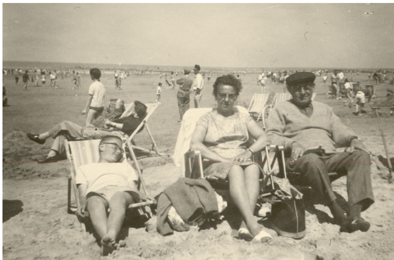
Heist-aan-Zee, vroegere jaren 60

Ze was bijzonder zorgzaam, maar kon ook vreselijk nerveus zijn. Ze kon zich opwinden over pietluttigheden. Kleine dingen konden gigantische proporties aannemen. Zo kon ze mijn broer en mij op maandag om halfzeven 's ochtends uit ons bed jagen, terwijl wij normaal pas om zeven uur opstonden. 'Ma, wat is er aan de hand?' vroegen wij dan. 'Zaterdag