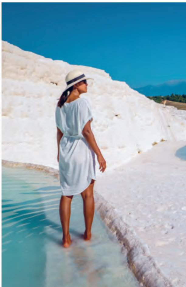
(following page)