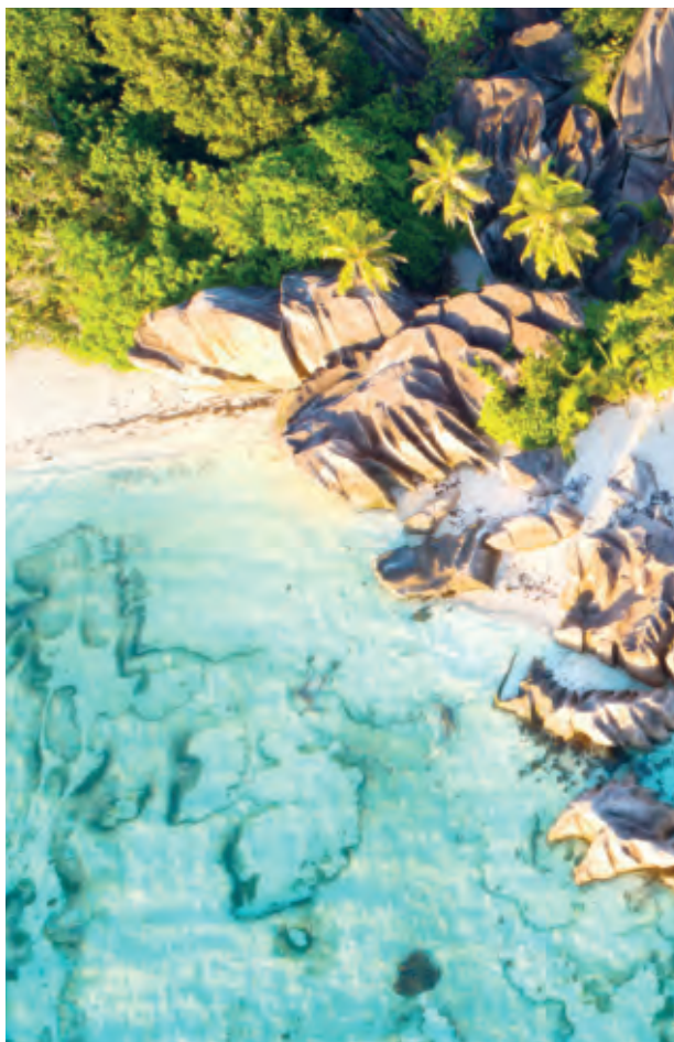
© EastVillage Images | Shutterstock, © Justin Foules | Lonely Planet, © Jenny Sturm | Shutterstock, © Danto Delmont | Alamy Stock Photo (following page)