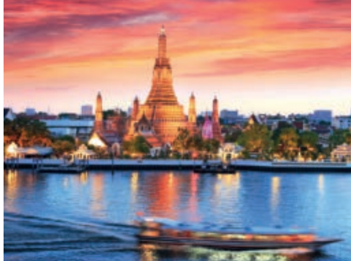
OP DE CHAO PHRAYA IN BANGKOK: blz. 158