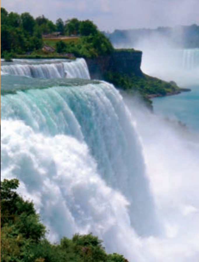
NIAGARAWATERVALLEN: blz. 62