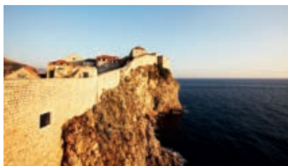
DUBROVNIK AAN DE DALMATISCHE KUST: blz. 176