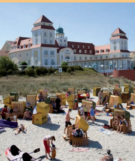
Het strand van Binz met op de achtergrond Hotel Kurhaus

De 'belle époque' van de Duitse Oostzeekust ontstond rond de eeuwwisseling van de 18e naar de 19e eeuw. In die tijd ontdekte men de heilzame werking van het baden in zee en laste de aristocratie regelmatig een verblijf aan zee in hun drukke