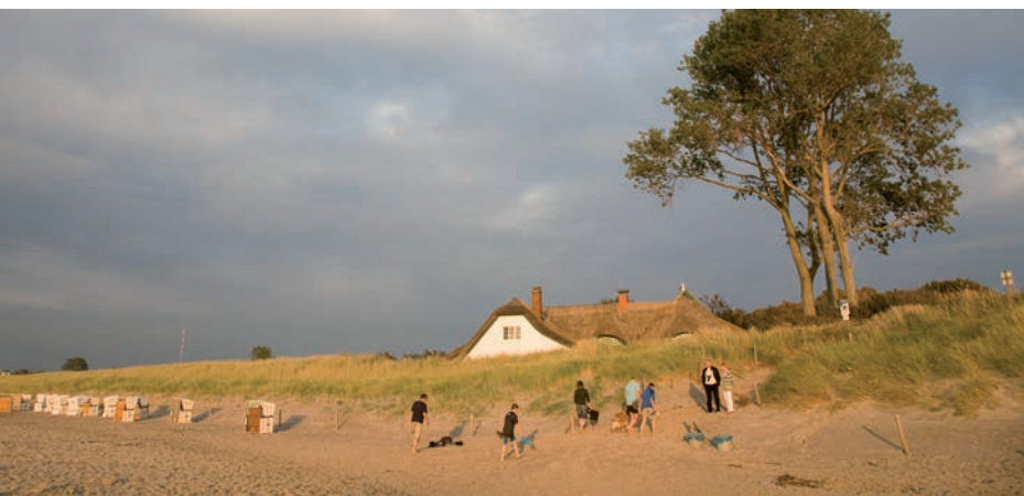
'Gouden uurtje' op het strand van Ahrenshoop

Ga, als je met je rug naar de ingang van de Kurverwaltung staat, rechtsaf en in de Dorfstrasse opnieuw rechtsaf. Steek de weg over en sla links af de Feldweg in. Na een bocht naar