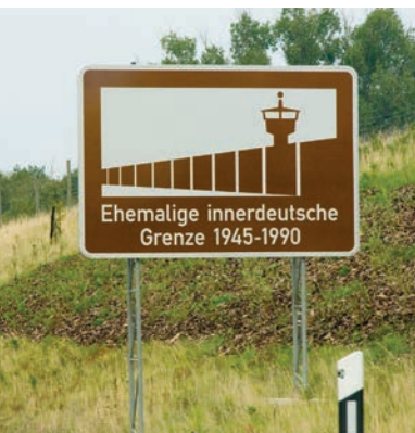
Tussen Lübeck en Wismar passeer je de vroegere grens

Sinds 1990 is Mecklenburg-Vorpommern een deelstaat van de Bondsrepubliek Duitsland. De veertig jaar dat het gebied bij de socialistische DDR hoorde, zijn echter nog niet uitgevlakt. Wat is er over van de jaren achter het IJzeren Gordijn? En wat merk je daar als toerist van?