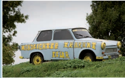
Trabantjes zijn populair

Grauwe betonnen woonkazernes zijn in in vele plaatsen nog te zien en historische panden wachten op een opknopbeurt, nadat ze als collectief eigendom in de DDR verwaarloosd en uitgewoond geraakt waren. Maar