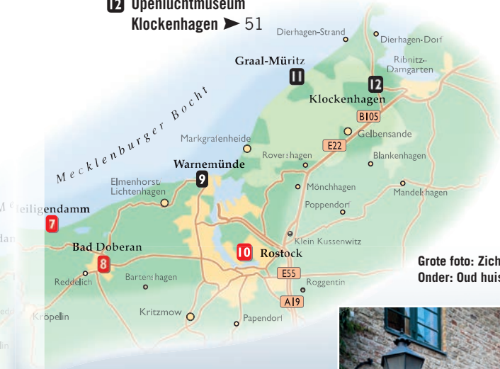
Grote foto: Zicht op Wismar Onder: Oud huis in Rostock