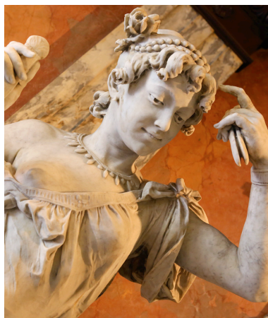
Muze in Teatro Nacional de Costa Rica in San José.

Links: een traditioneel ossenkar-wiel in de Fábrica de Carretas Eloy Alfaro, Sarchí.