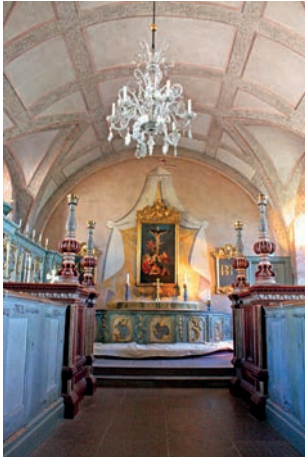
De kapel in Kalmar slott

De kern van Zuid-Zweden wordt gevormd door Småland, een gebied met tussen de bossen en meren vooral veel historie. Oude boerderijen staan hier nog overeind, je kunt wandelen door glooiende weilanden uit de tijd van botanicus Carl Linnaeus en ontdekken waarom schrijfster Astrid Lindgren zich liet inspireren door de Smålandse natuur.