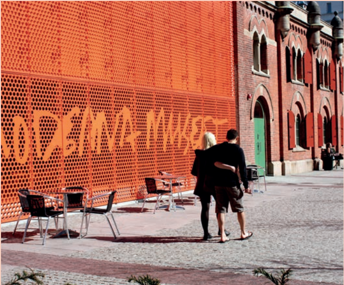
Moderna Museet in Malmö, gevestigd in een industrieel pand

Rijd op de terugweg door het zuiden van de provincie Skåne, door de artistieke fruitstreek 12 Österlen (► 56), met het bijzondere stenen schip in 10 Kåseberga (► 54). Van daaruit ben je binnen een uur weer in Malmö.