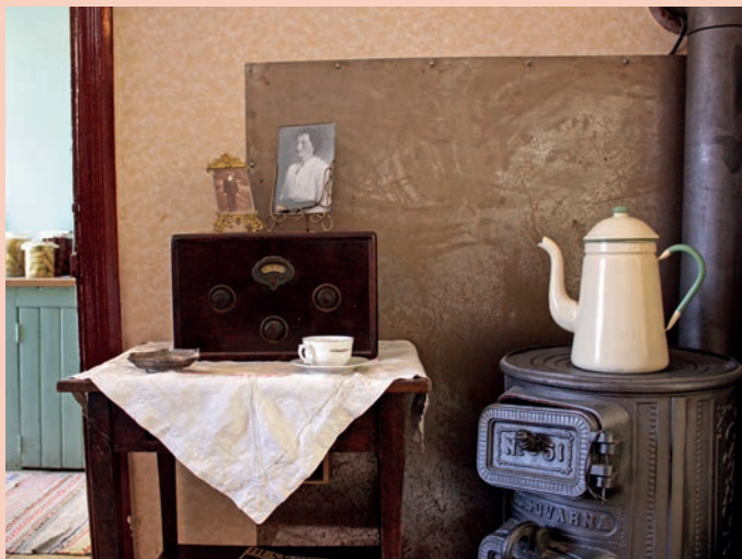
Huiskamer in museum Kulturen in Lund

Zuid-Zweden is prima bereikbaar vanuit Nederland en België: met de auto ben je in circa negen uur in Malmö. Vanuit het vlakke landschap in het zuiden rijd je al snel over goede wegen door de bossen van Småland. Of neem iets langer de tijd en rijd van vuurtoren naar vuurtoren op het eiland Öland.