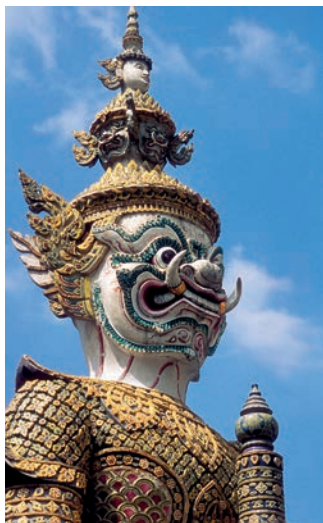
Een rijkversierd beeld bewaakt de Wat Phra Kaewtempel in Bangkok

als Joseph Conrad en Graham Greene en bestel een kop thee in een van de beste hotels ter wereld, het Oriental. Geniet van de vele winkels, van de weekendmarkt Chatuchak en breng een bezoekje aan de schatten van het nationaal museum, waar de geschiedenis van Thailand en zijn koninklijke familie uit de doeken wordt gedaan.