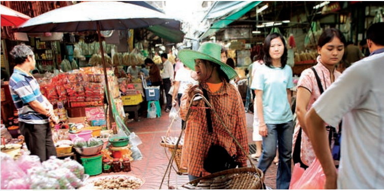
Verkopers op de drukke Chinatownmarkt