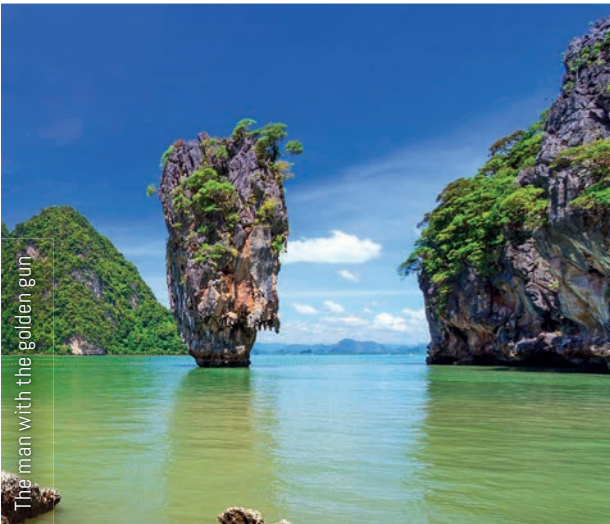
The man with the golden gun

– Reis je favoriete films en series achterna –