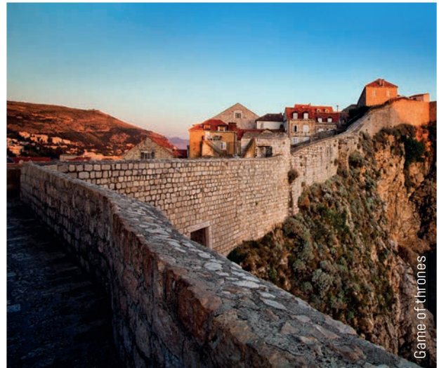
Game of thrones