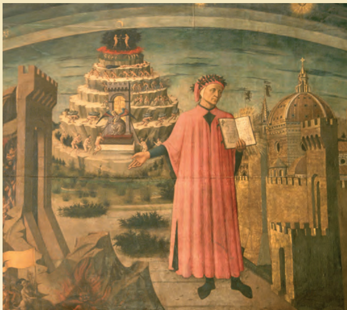
Detail uit Dante en de drie koninkrijken van Domenico di Michelino

Dante Alighieri werd geboren in Florence in 1265. Hij diende de stad als diplomaat, maar werd in 1302 verbannen op grond van verzonnen beschuldigingen. De laatste jaren voor zijn dood zwierf hij van stad naar stad door Noord-Italië. Hij stierf in 1321 in Ravenna, waar hij ook begraven is. Zijn meesterwerk, het episch gedicht La Divina Commedia ( De goddelijke