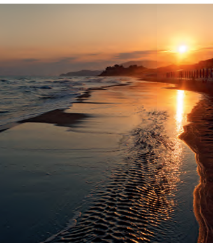
Zonsondergang bij Castiglione della Pescaia

De barokke villa bij Lucca, het schilderachtige stenen huis in de Chianti, de privéwellnessoase in de Val di Merse – wat veelal onder de noemer 'agriturismo' aangeboden wordt, heeft meestal niets meer te maken met het idee kleine boeren zo aan een extra inkomstenbron te helpen. Authentiek verblijf 'bij de boer' vind je doorgaans alleen in de toeristische randgebieden. Niettemin is de Toscaanse versie van 'vakantie op de boerderij' nog altijd de beste manier om land en bevol-