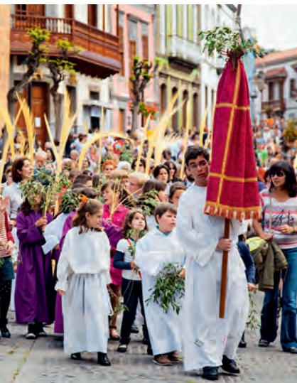
Palmzondagsprocessie in Teror

Om de religieuze inborst, maar ook de uitbundigheid van de inwoners van Gran Canaria te leren kennen, moet je echt eens een religieus feest bijwonen. Het grootste is 'La Virgen del Pino' in Teror, in het binnenland. Maar elke dorpskermis is minstens zo indrukwekkend, want vrijwel elke gemeente eert eens per jaar de eigen beschermheilige – eerst met een kerkelijke mis of processie, daarna met goede spijzen, dans en vuurwerk.