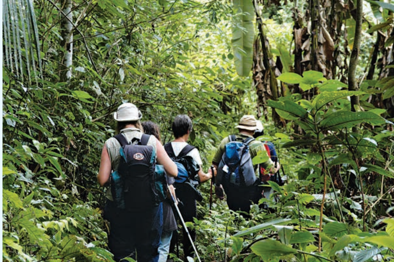
Wandelaars volgen de Trilha do Ouro (het goudpad) in Parque Nacional da Serra da Bocainak.

in het stadsdeel Pelourinho Centro Histórico getuigen. Wie graag de natuur in trekt, kan vanuit Salvador naar Chapada Diamantina reizen, zo'n 400 km landinwaarts; dit is een spectaculair nationaal park met rotsplateaus en watervallen. U kunt langs de zuidkust van Bahia ook de prachtige stranden langs het Atlantisch Woud gaan bekijken. Recife en zusterstad Olinda zijn ook mooie plaatsen in het noordoosten om te bezoeken – vanuit Recife kunt u de Cariri-regio bezoeken, waar zich de kurkdroge sertão bevindt.