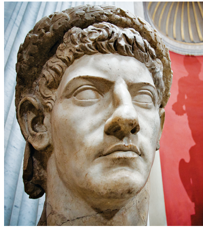
Borstbeeld van keizer Claudius, Vaticaanse Musea; hiernaast: het interieur van de dom van Parma, een 12e-eeuwse romaanse kathedraal.