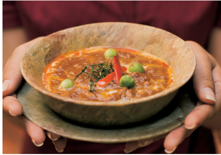
Geniet van een kom curry bij Malis, een nieuw nachtrestaurant in Phnom-Penh (zie 'Reiswijzer', p. 287).

Vermijd het Cambodjaanse leidingwater, hoewel het prima is om tanden mee te poetsen. Fleswater is overal verkrijgbaar en goedkoop ■