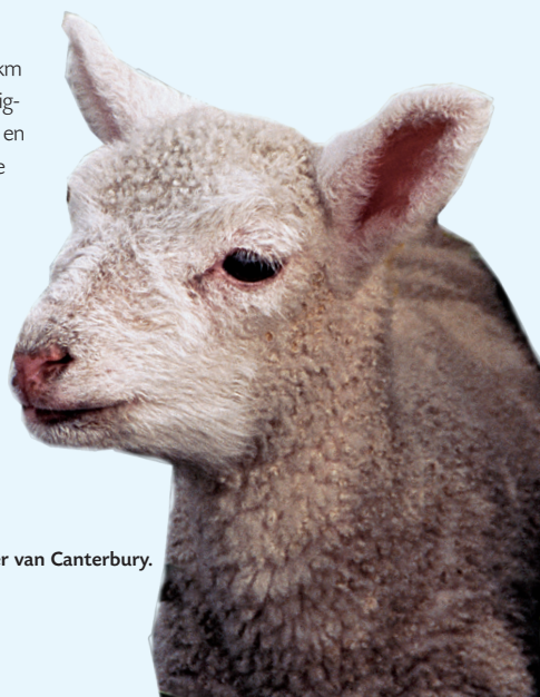
Bewoner van Canterbury.

Vanuit een telefooncel kunt u met muntgeld, creditcard of prepaid-kaart internationaal bellen. Internationale telefoonkaarten, verkrijgbaar bij krantenkiosk en supermarkt, zijn voor intercontinentale gesprekken het goedkoopst. Een Nieuw-Zeelandse prepaidkaart voor uw mobiele telefoon is een nuttige aankoop. Toets voor internationale gesprekken eerst 00 en vervolgens het landnummer, netnummer (zonder de 0) en het abonneenummer. (Zie Reiswijzer p. 280.)