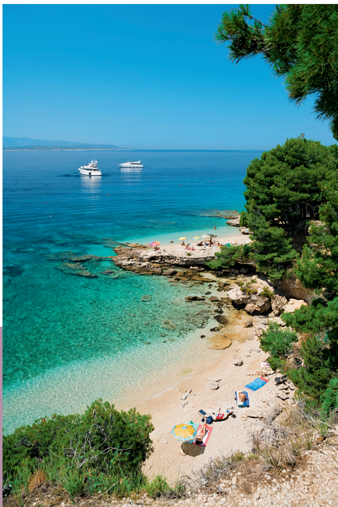
Kiezelstrand in een afgelegen baai op het eiland Brač