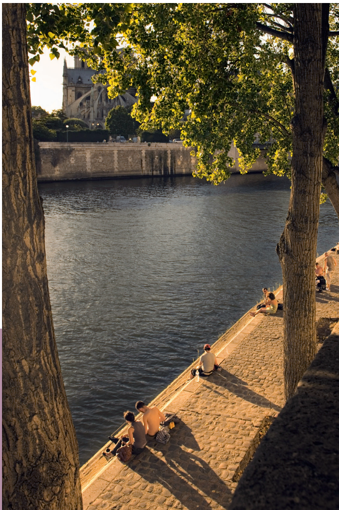
De oever van de Seine bij avond