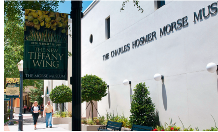
Het Charles Hosmer Morse Museum

Schilderijen, beelden en kunstnijverheid van andere kunstenaars uit de periode 1850 tot 1930 kun je in dit museum ook zien.