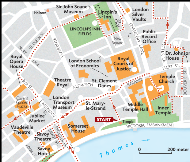
WANDELKAART THE STRAND EN COVENT GARDEN