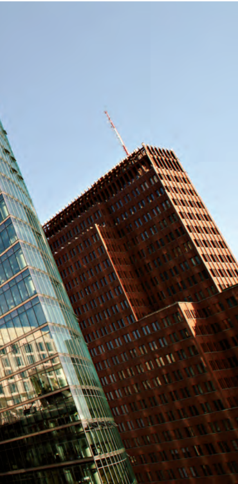
De nieuwe skyline van Berlijn met het Sony Center, de Bahnturm en het Killhofgebouw, op de verjongde Potsdamer Platz.

Een groot deel van de stad was door de bombardementen in de oorlog en de sloop daarna verdwenen, maar de oplossing lag