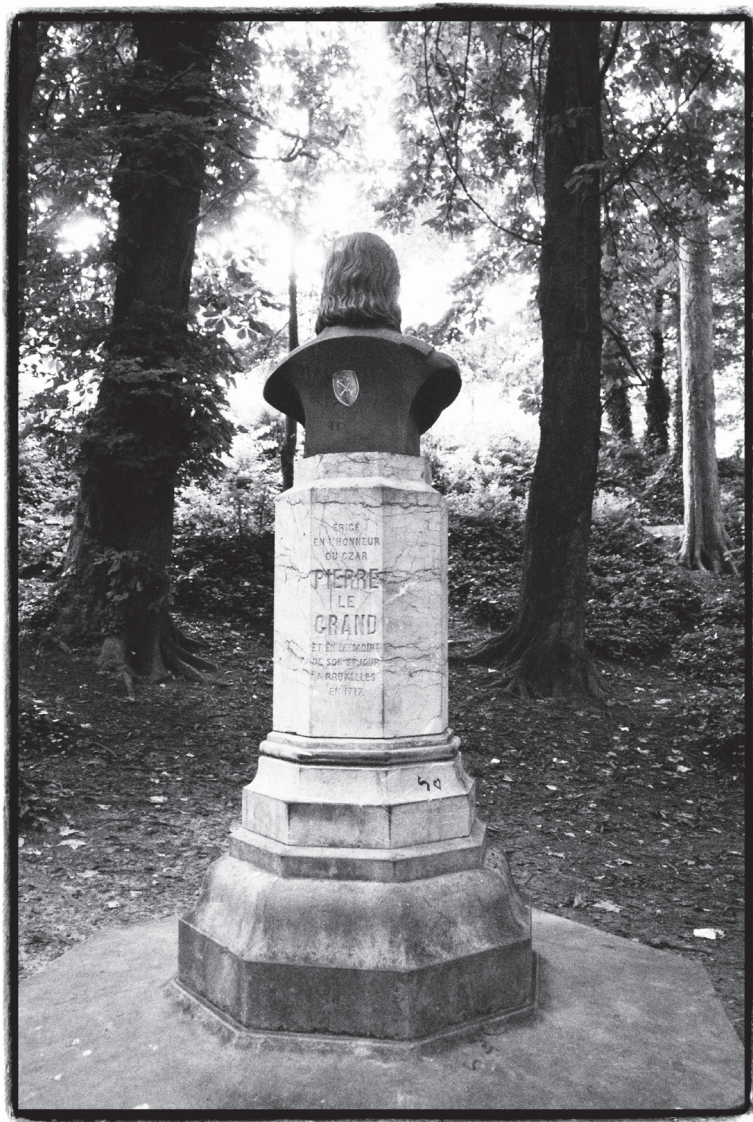
Wie Peter de Grote wil zien, moet een 'toerke' doen.