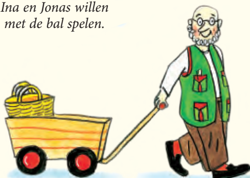
Frederick moet heel wat vervoeren.