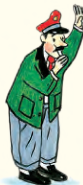
Hugo de politieagent heeft het druk.