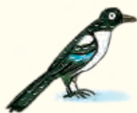
Eksters vinden de vreemdste dingen.