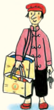
Sieglinde staat foutgeparkeerd.