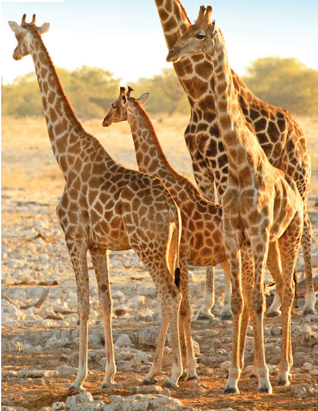
(L) The Wizarding World of Harry Potter in Universal Orlando, Florida; (R) Giraffen spotten op safari; (B) Surfles in Sri Lanka