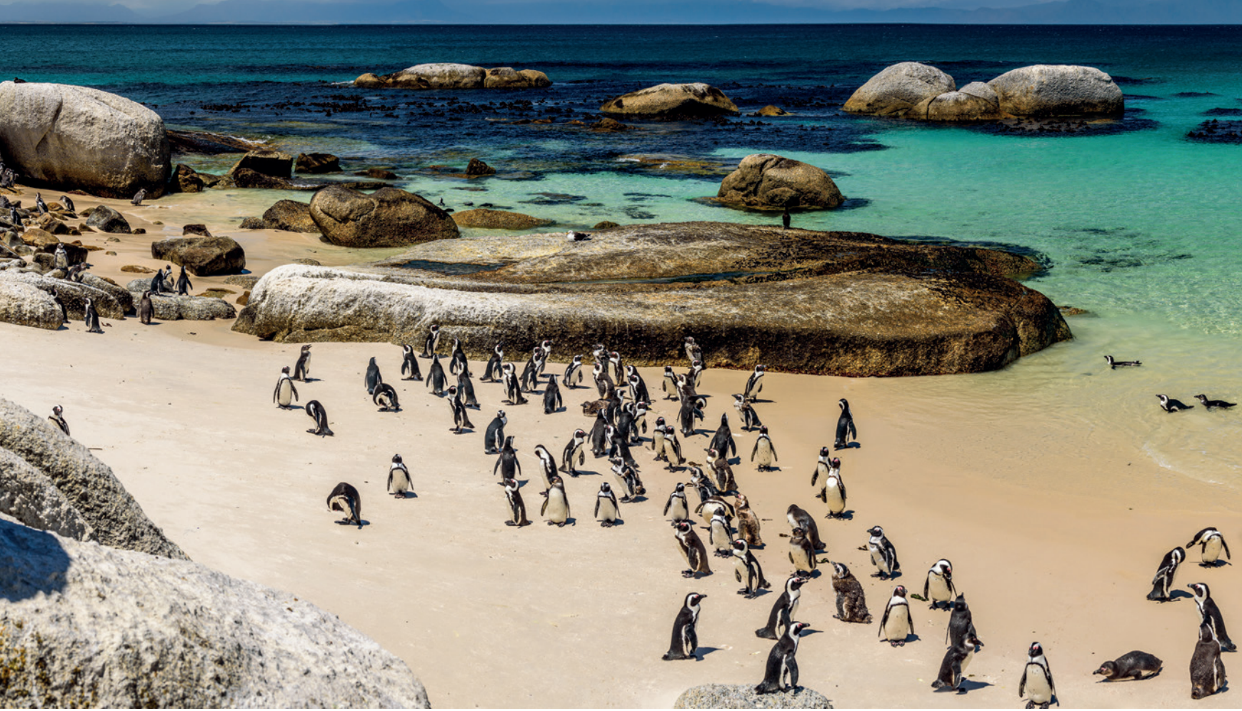
(B) Pinguïns op Boulders Beach, Zuid-Afrika; (L) Up Helly Aa: guizers in Lerwick, Shetlandeilanden; (R) Het Luna Park in Melbourne, Australië