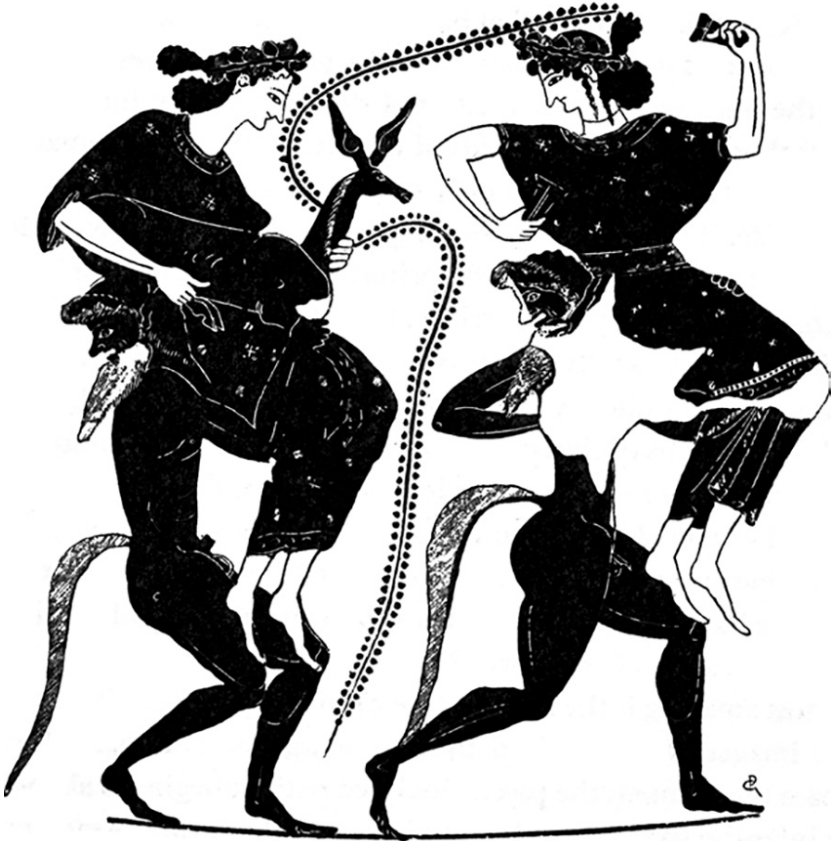
AFBEELDING 3. Silenen en maenaden (zwartfigurige amfora, Helleens, Sicilië, ca. 500-450 v.Chr.)

onmiddellijk te zullen offeren, als offerande en symbool van dienstbaarheid. De stier was uit zee opgedoken en Minos besteedde de troon, maar toen hij de pracht van het dier dat was gestuurd had aanschouwd en bedacht hoe heerlijk het zou zijn zo'n exemplaar te bezitten besloot hij een kleine ruil te riskeren; een ruil waar, naar hij veronderstelde, de god niet al te zwaar aan zou tillen. Nadat hij op het altaar van Poseidon de mooiste witte stier die hij bezat had geofferd, voegde hij de andere toe aan zijn kudde.