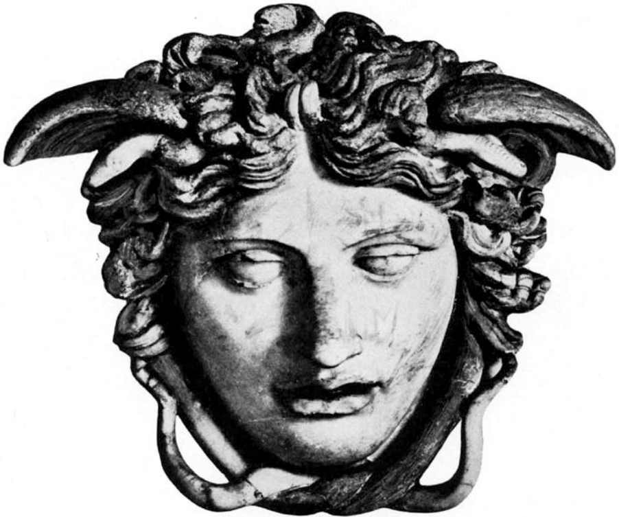
AFBEELDING 1. Medusa (marmer, Romeins, Italië, datum onbekend)