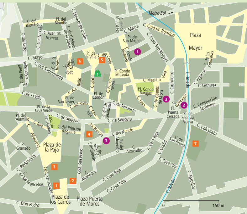
Uitneembare kaart 2, C/D 6/7 | Metro L1, L2, L3 Sol

Alles wordt hier door nonnen gemaakt: taart, marmelade, chocolade en natuurlijke zeep. Het charmante winkeltje El Jardín del Convento 1 (Cordón 1, eljardindelconvento.net, di.-zo. 11-14.30, 17.30-20.30 uur, in aug. gesl.) ligt achter het Carbonerasklooster.