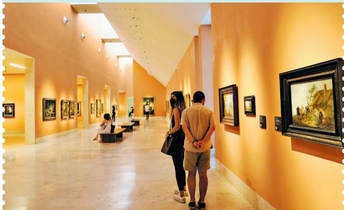
De kunst van Baron Thyssen – opwindend en behoorlijk intellectueel. Geweldig

Rustdagen: veel musea zijn op ma. gesloten. Over het algemeen zijn ook 1 en 6 januari, Goede Vrijdag, 1 en 2 mei en 25 december rustdagen.