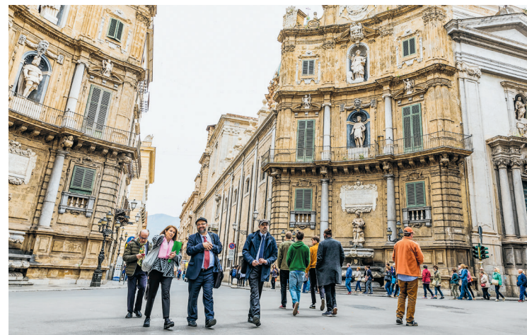
Het stadsleven op de Quattro Canti – tegenwoordig voetgangersgebied: in de loop van de dag schijnt de zon altijd op een van de vier hoeken, daarom wordt het plein ook wel Teatro del Sole genoemd

Na hun verovering zetten de Noormannen het beleid van religieuze tolerantie van de Arabieren voort. Arabische en Byzantijnse bouwmeesters, ambachtslieden en kunstenaars bleven in de stad en creëerden samen met de Lombardische en Normandische meesters de unieke combinatie van stijlen van de Arabieren en de Noormannen. Een stijl die triomfen viert